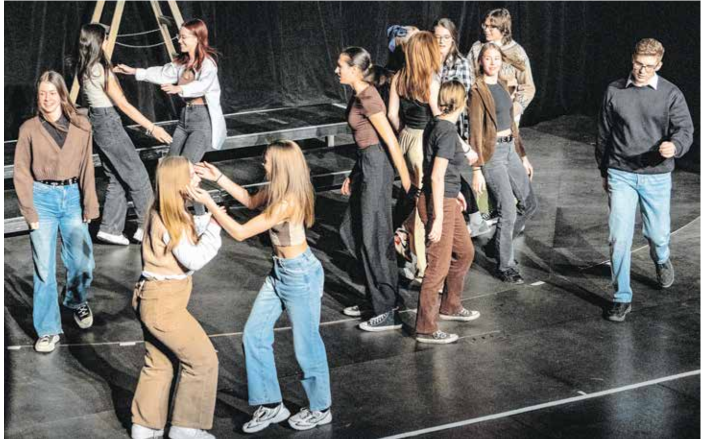
Az idei évadban 6 iskola 120 diákja csatlakozott az „Így irtok ti – így játszunk mi” című színpadi felhíváshoz. Múlt héten mutatták be produkcióikat a Soproni Petőfi Színházban. Felvételünkön az Eötvös-középiskola diákjai.