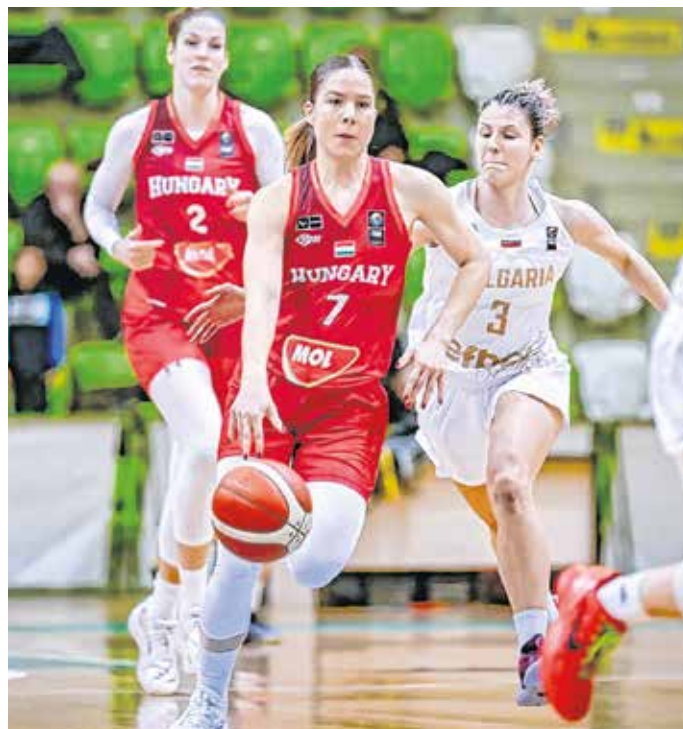
A magyar válogatott Bulgáriában kikapott, így lemaradt az idei kontinensviadról.

– Bulgáriában 21 ponttal kellett volna győzni. A bolgár csapat elleni hazai