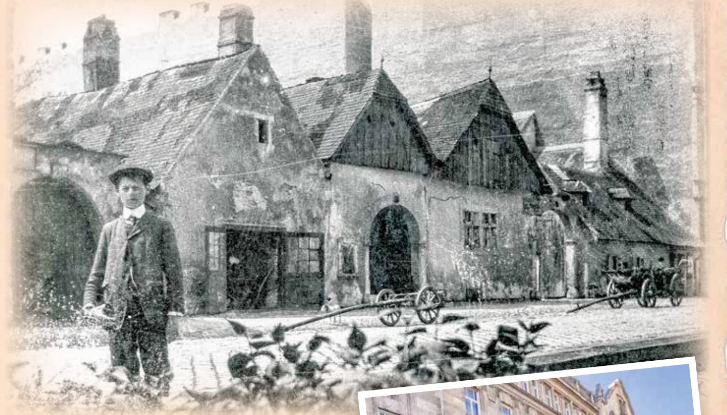
A postapalota építéskor lebontott házak a Széchenyi téren.