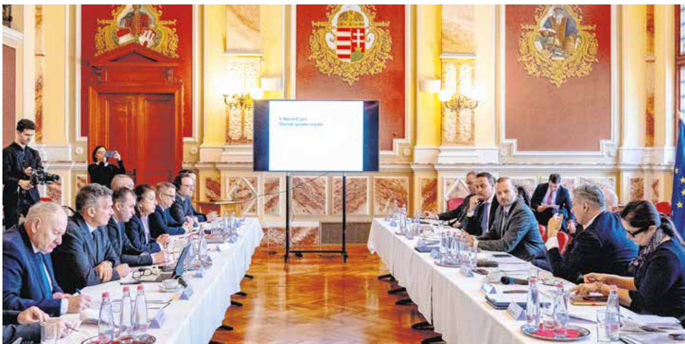
Munkalátogatásra érkezett Sopronba Lázár János (j2) építési és közlekedési miniszter.

(A részletekről a jövő heti számunkban tájékoztatjuk olvasóinkat, de a legfontosabb információk már elérhetőek a Soproni Téma hivatalos Facebook-oldalán.)