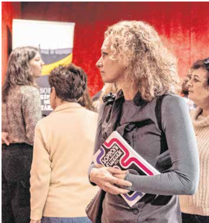
A Soproni Füzetek 2024-es számát a hagyományok szerint az adventi tárlaton mutatták be.