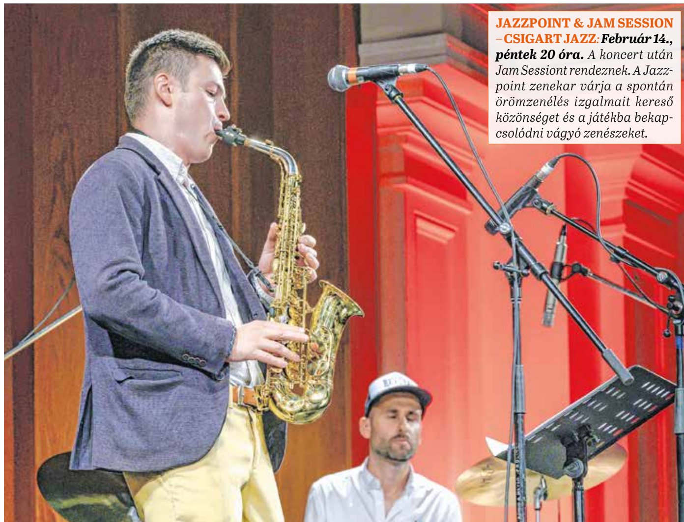
A Jazzpoint zenekar három éve alakult, a soproni zeneiskola dzsessz tanszakának tanáraiból áll.

– Mivel a Csigart Jam Session sorozatok úgynevezett „házi” zenekara vagyunk, elsődleges céljaink közt szerepel idén is a rendszeres örömszene meg szervezése,