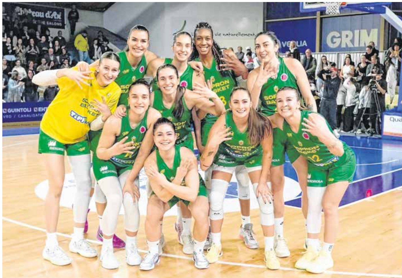
A Sopron Basket a Montpelliert legyőzte a négy közé jutásért. Felvételünkön az ünneplő csapat.

– Nyilván nagyon fontos volt, hogy egy biztos előny bir- tokában utazhattunk a visz- szavágóra. Ugyanakkor azt is hozzá kell tennem, hogy a Montpellier-ben rendezett mérkőzésen 25 percnél ke- resztül kiválóan játszottunk, 13 ponttal is vezettünk. Érde- kes ezeknek a kupameccseknek a pszichológiájuk, hiszen ilyen előny tudatában kicsit