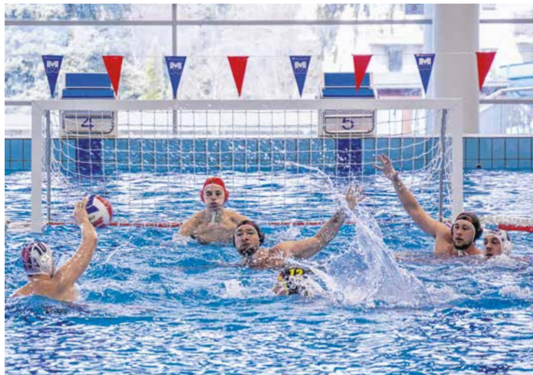
A vezetőedző szerint egyre jobb a csapategység a SMAFC vízipólósainál.