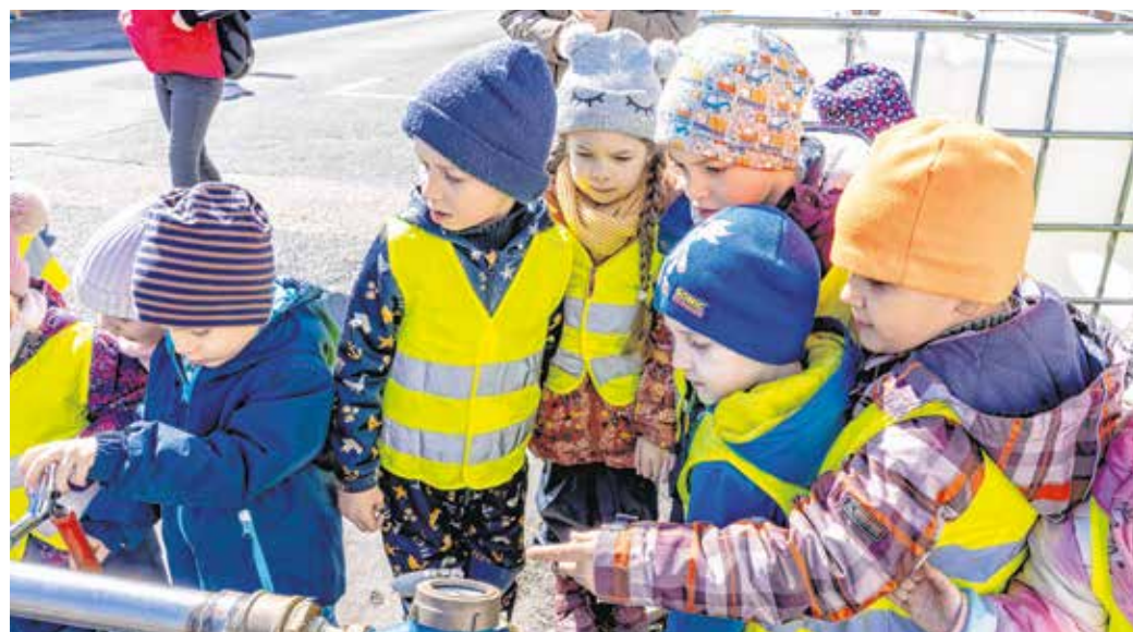
26 különböző állomáson mutatták be a gyerekeknek a munkagépeket, a vízhálózatot, a laboratóriumi kísérleteket és a vízmérés folyamatát.