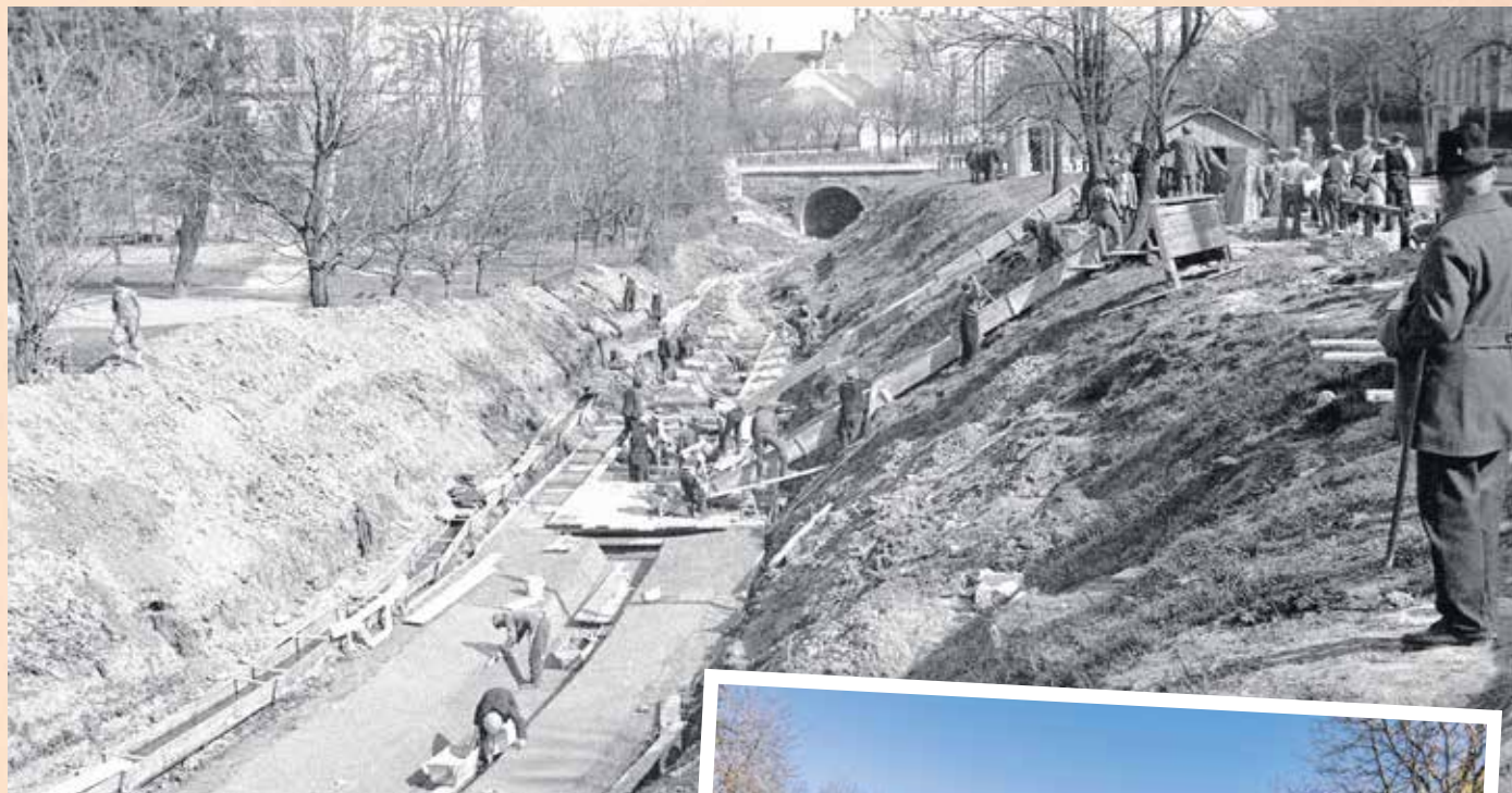
A Rák-patak befedése a Frankenburg úton, balra a későbbi Gödör játszótér mélyebben fekvő helye. FOTÓ: DIEBOLD KÁROLY, 1934., SOPRONI MÚZEUM

Az igazság, hogy szó sincs erről, ez volt tulajdonképpen a Rák-patak ártere. Az Evangélikus Líceum és Tanítóképző Intézet 1937-es értesítőjében említést tettek egy Kerti-lakról, ami jellegzetes része volt a „gödörnek” – így említették –, még fényképet is mellékeltek, amin látszik, hogy az épület a patak mellett, a mélyebben fekvő területen áll. Sajnos, a Rák-patak befedése után a falai annyira vizesek lettek, hogy semmire nem volt használható, így lebontották. Ha a tanítóképző főépületét megvizsgáljuk, a képeken is látható, hogy utcafrontról kétszintes, a kert felől háromszintes volt, tehát a kertje egy gödörben volt. A második világháborús bombázásokról készült légifelvételre is kivehető, hogy valóban