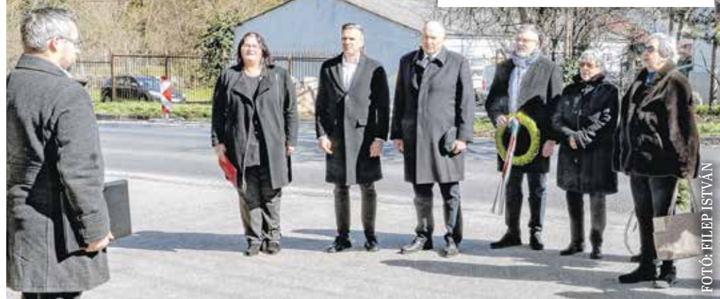
Koszorút helyeztek el Mindszenty József emléktáblájánál a sopronkőhidai börtönnél.

A NYILASOK ITT TARTOTTÁK RABSÁGBAN IKISIPAPJAIVAL EGYÜTT 1944. KARÁCSONYAN MINDSZENTY JÓZSEF VESZPRÉMI PÜSPÖKÖT