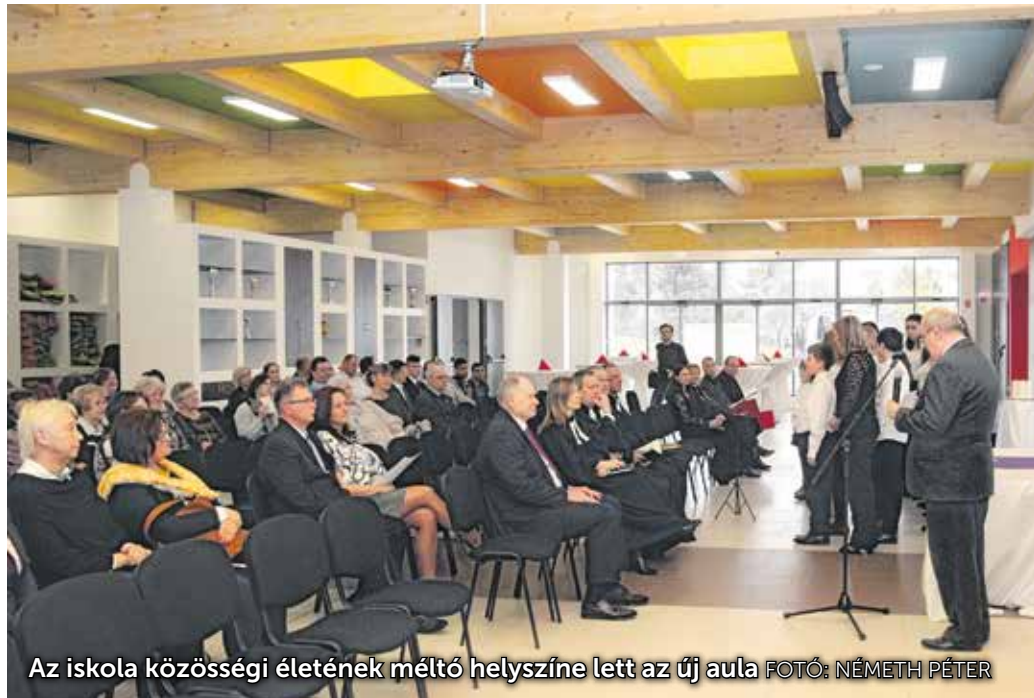
Az iskola közösségi életének méltó helyszíné lett az új aula

Átadták a Hunyadi János Evangélikus Óvoda és Általános Iskola új auláját. A közösségi teret Szemerei János püspök szentelte fel az elmúlt pénteken.