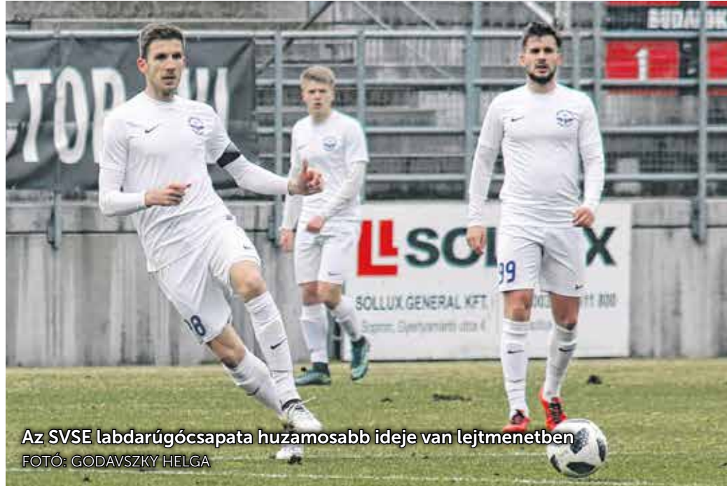
Az SVSE labdarúgócsapata huzamosabb ideje van lejtmenetben

A mérkőzésről mindent elmond Bekő Balázs nyilatko-