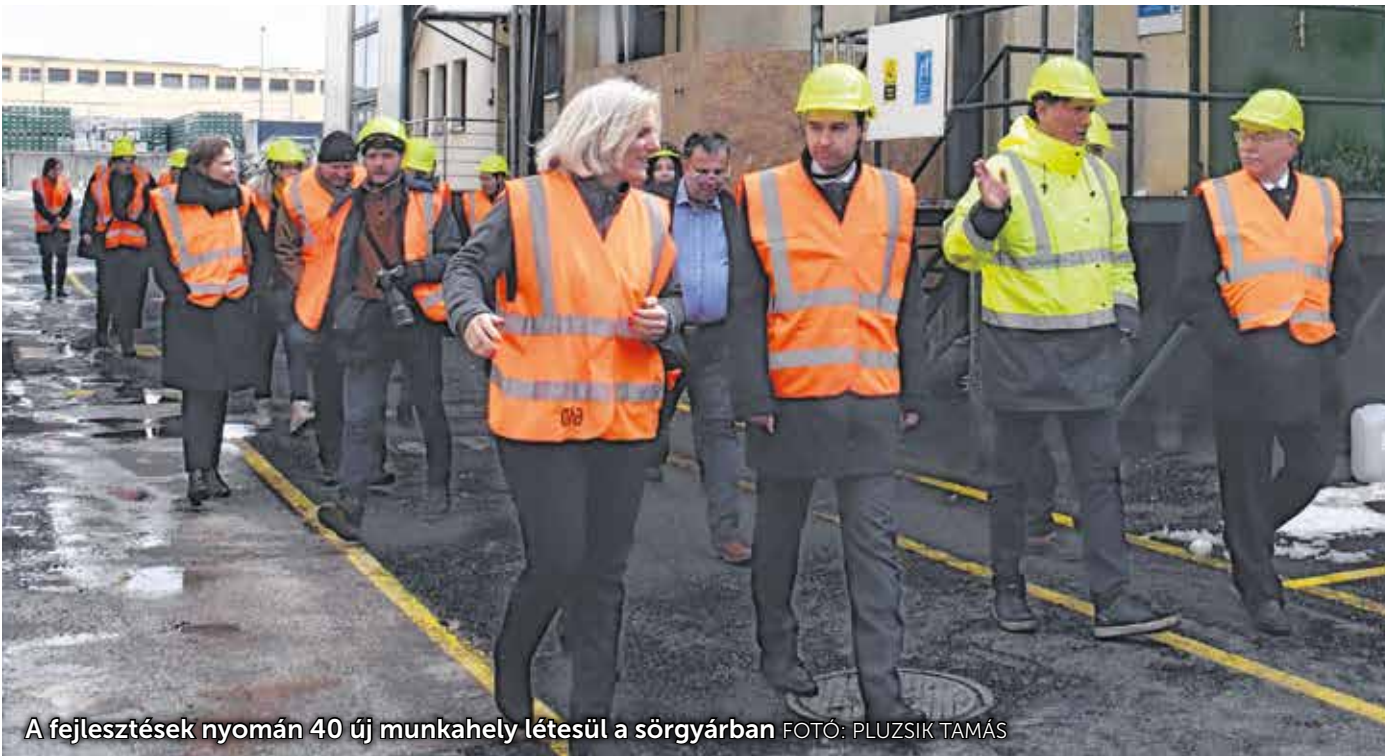
A fejlesztések nyomán 40 új munkahely létesül a sörgyárban