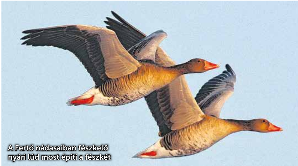
A Fertő nádasában fészkelő nyári lúd most építi a fészket