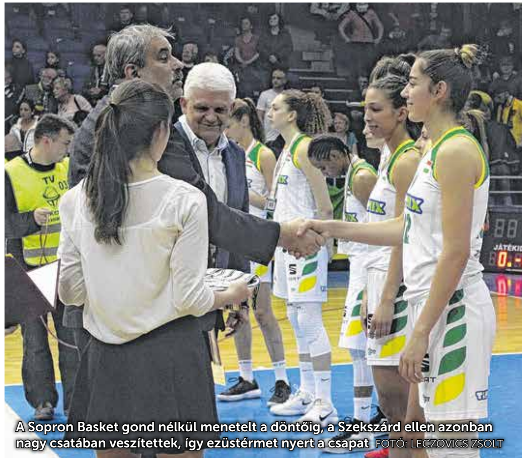
A Sopron Basket gond nélkül menetelt a döntőig, a Szekszárd ellen azonban nagy csatában vesztettek, így ezüstérmet nyert a csapat.

A döntőben kevés kosárest, a soproni támadásoknál