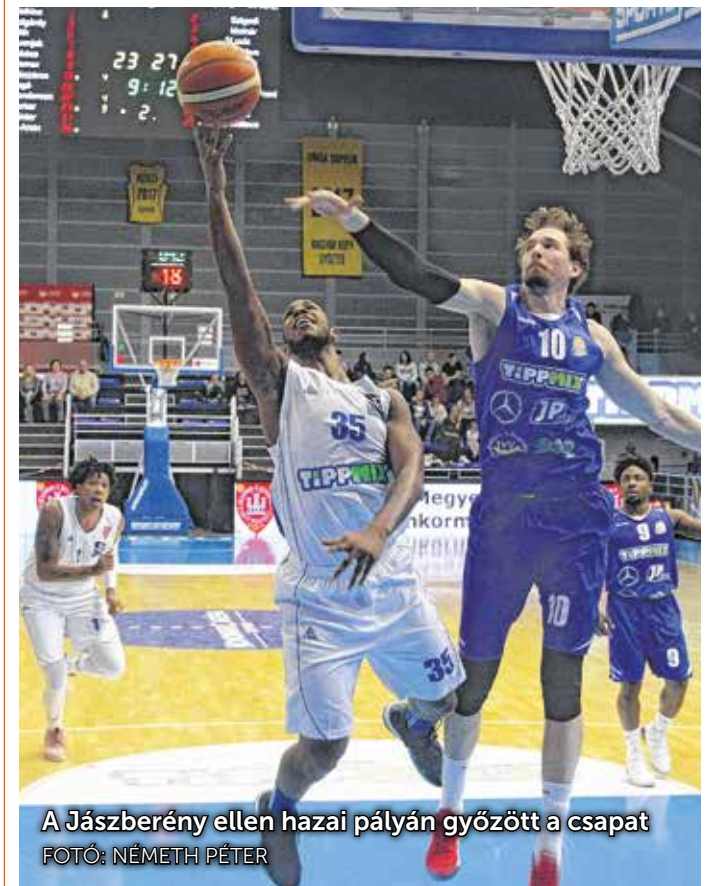
A Jászberény ellen hazai pályán győzött a csapat