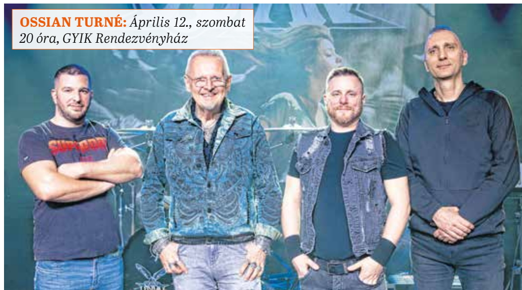
OSSIAN TURNÉ: Április 12., szombat 20 óra, GYIK Rendezvényház

– Így igaz, teljes mértékben soproni erők segítségével állt össze a klip. Előtte kértem forgatókönyvötleteket profi stáboktól, akiket egyébként rendkívül nagyra tartok, de most nem találkoztak az elképzeléseink. Én egy visszafogott, nagyon emberi és elsősorban őszinte klipet szerettem volna. Úgyhogy vettünk egy nagy lélegzetet, és elkezdtük a szervezkedést. Minden ismerősünk és barátunk ezerral segített.