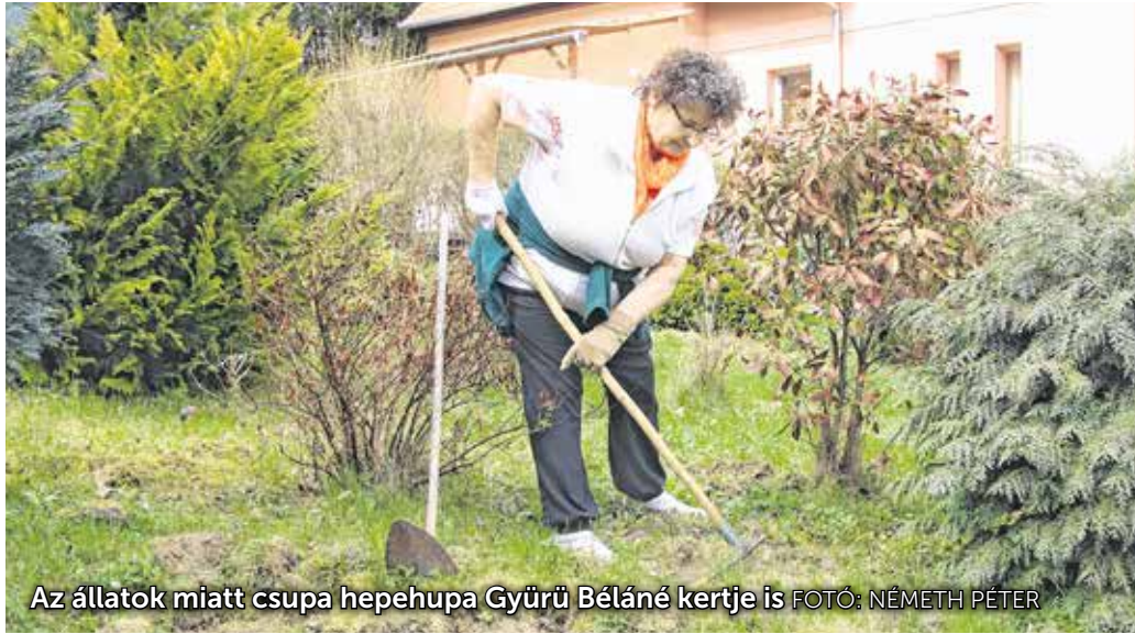
Az állatok miatt csupa hepehupa Gyűrű Béláné kertje is

dik a Lövérék magasan fekvő kertjeibe. A tulajdonosok dühösek, hiszen a földet feltúrják, a növényeket tönkreteszik az állatok. A lövérekbeliek nem szívesen találkoznak a vaddisznókkal alkonyatkor.