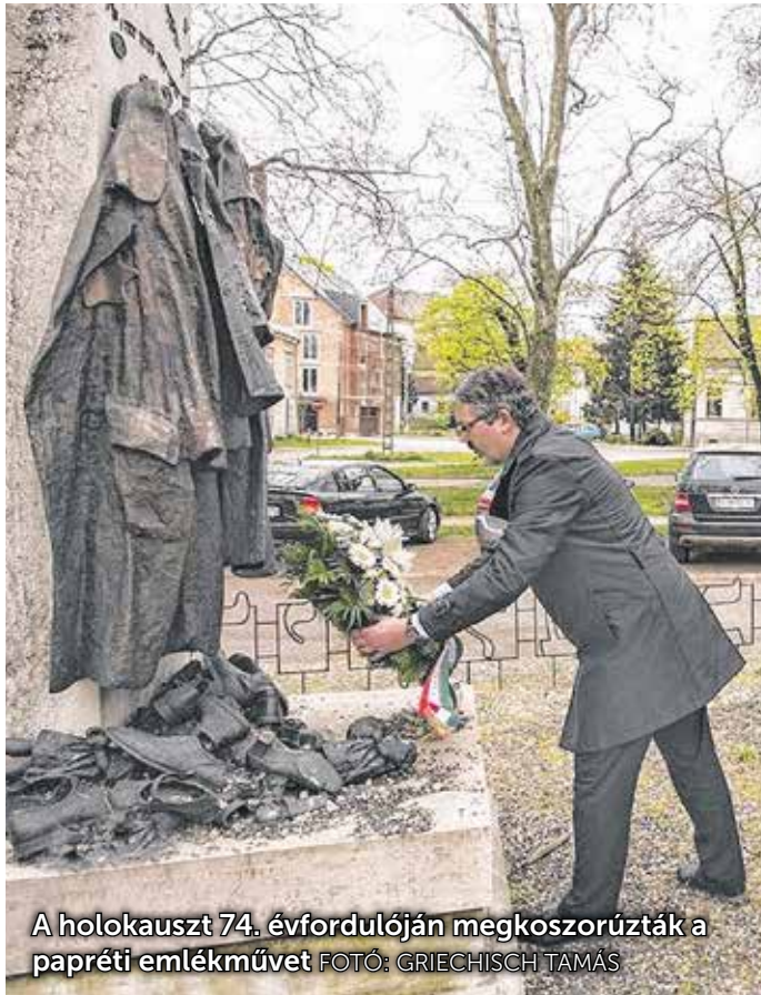
A holokauszt 74. évfordulóján megkoszorúzták a papréti emlékművet