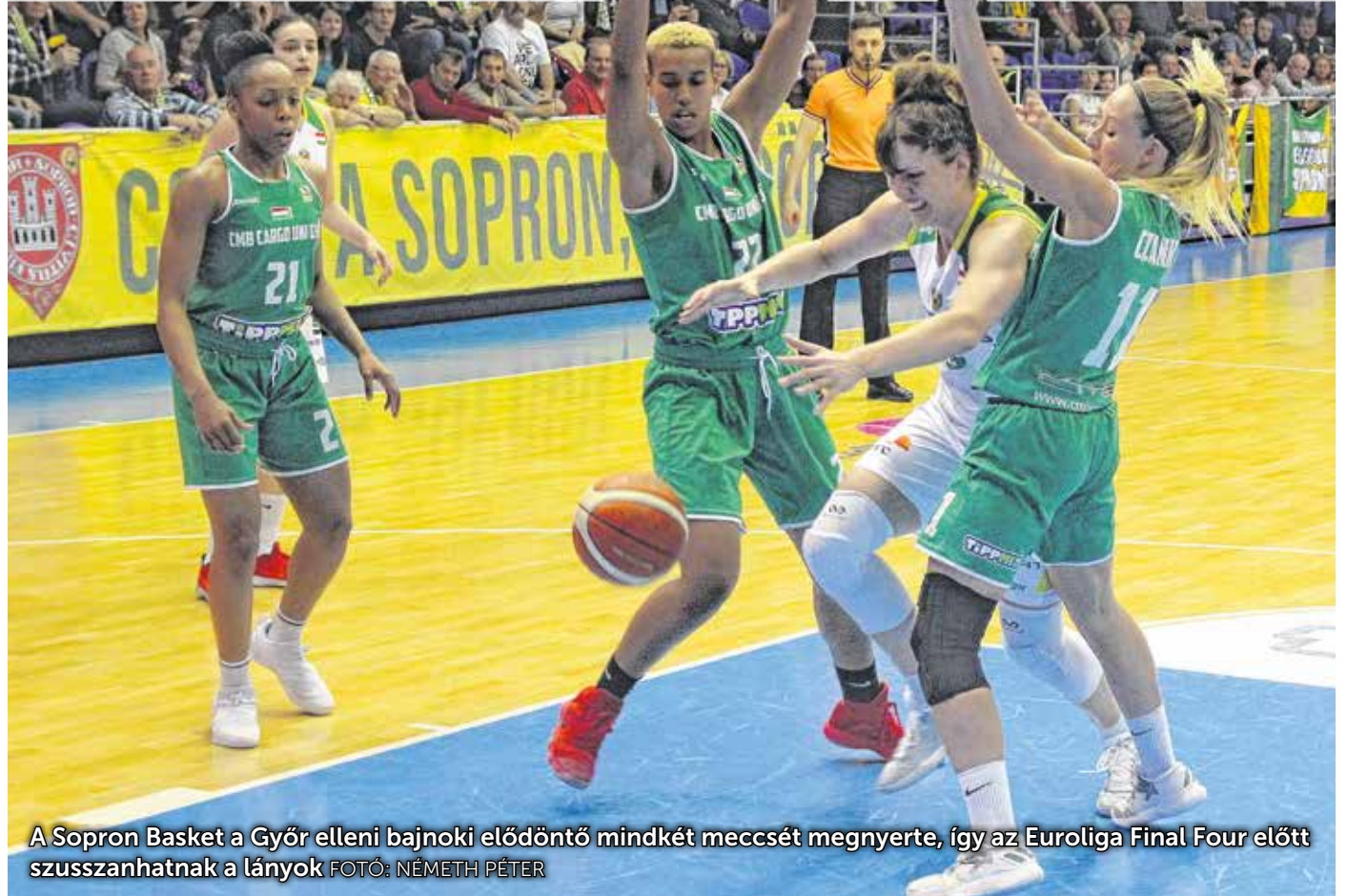
A Sopron Basket a Győr elleni bajnoki elődöntő mindkét meccsét megnyerte, így az Euroliga Final Four előtt szusszanhatnak a lányok

A győri mérkőzésen már csak azért is nyernie kellett Roberto Iniguez csapatának, hogy az Euroliga négyesdöntője előtt minél többet tudjanak pihenni a lányok. A meccs első két negyede még szoros volt, Crvendakicot azonban nem tudták tartani a győriek, a soproni játékos 20 ponttal és fantasztikus, 4/6-os hárompontos mutatóval zárt. Milovanovic és Jovanovic is sokat tett hozzá a játékhoz, így végül meglett a két szempontból