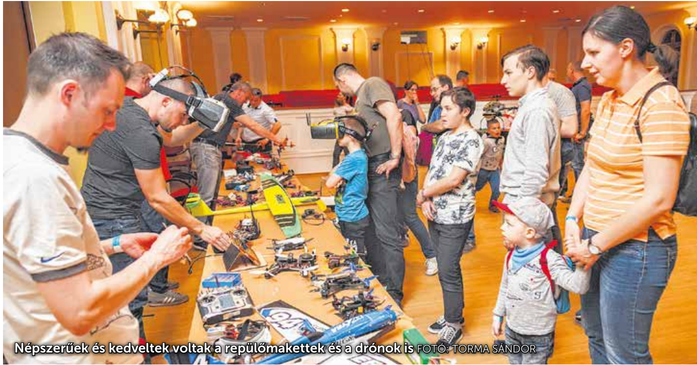
Népszerűek és kedveltek voltak a repülőmakkok és a drónok is

Népszerű volt a „Szárnybontogató” családi nap a Liszt-központban: közel 400 látogatója volt a szombat délutáni programnak. A családok évében meghirdetett rendezvénnyel a madarak éve előtt is tisztelegtek a szervezők, és a közelgő 11. Soproni Tündérfesztiválra is szárnyat bonthattak az érdeklődők.