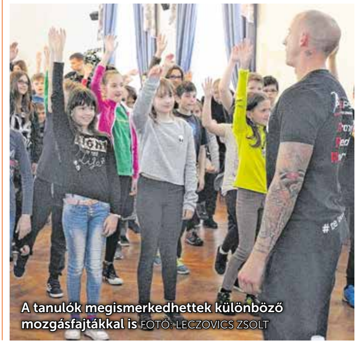
A tanulók megismerkedhettek különböző mozgásfajtákkal is