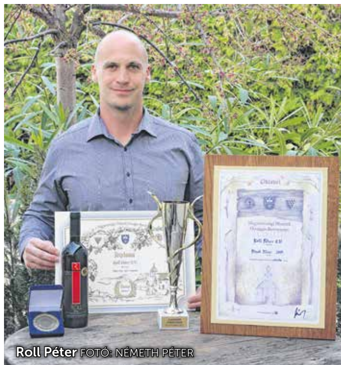
Roll Péter

A versenyen egyébként is sikeresen szerepeltek a soproni gazdák. Iváncsics Zoltán három aranyérmet is nyert (shiraz 2015, zöld veltelini 2017, merlot rozé 2017). Aranyérmet kapott a Taschner Borház 2016-os cabernet franc nedűje és a Roll-pincészet 2017-es kékfrankos rozéja. Ezüstérmet nyert a Gangl-pincészet, a Bónis-Reitter borászat, és Rollék is bezsebeltek még egy-egy ezüstöt.