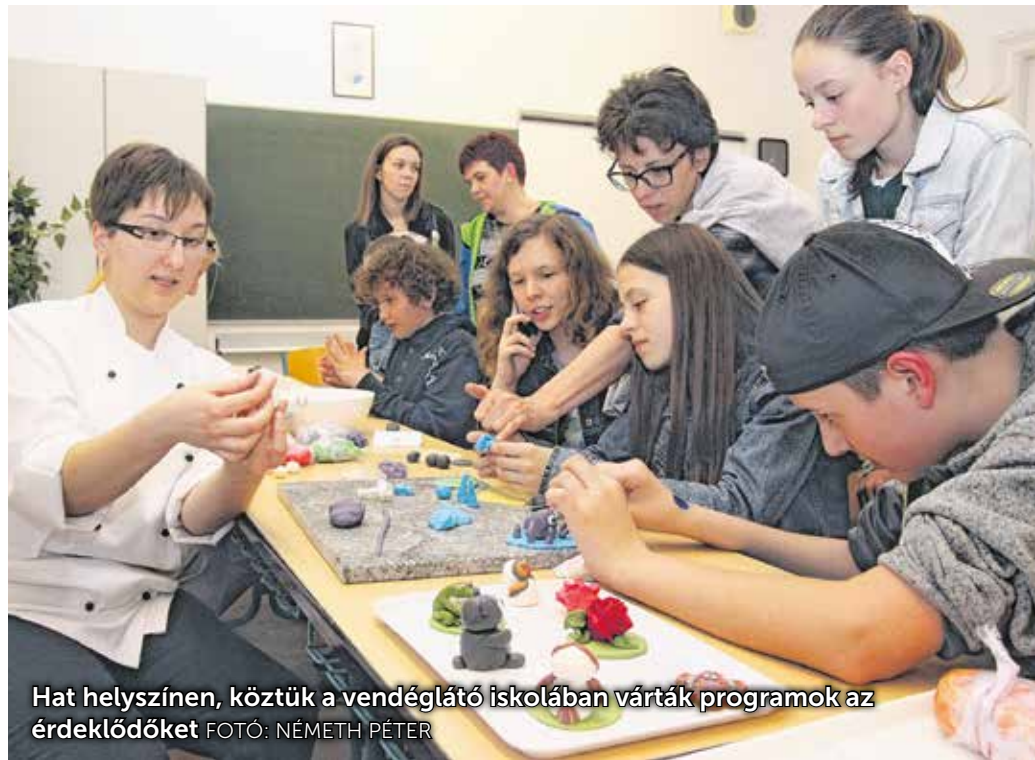
Hat helyszínen, köztük a vendéglátó iskolában várták programok az érdeklődőket

– Az elmúlt években megkezdett szakképzés oktatásának fejlesztése és fejlődése, amely a kormányzati támogatás aktív részvétele mellett zajlik, a soproni tanulói létszámokban már nyomon követhető, hiszen egyre több fiatal választja valamelyik szakmát élete hivatásának – tette hozzá Barcza Attila önkormányzati tanácsnok, a térség választott országgyűlési képviselője.