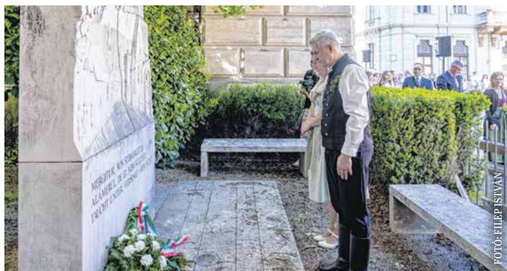
A megemlékezés zárásaként a résztvevők koszorúkat helyeztek el a kitelepítési emlékműnél.