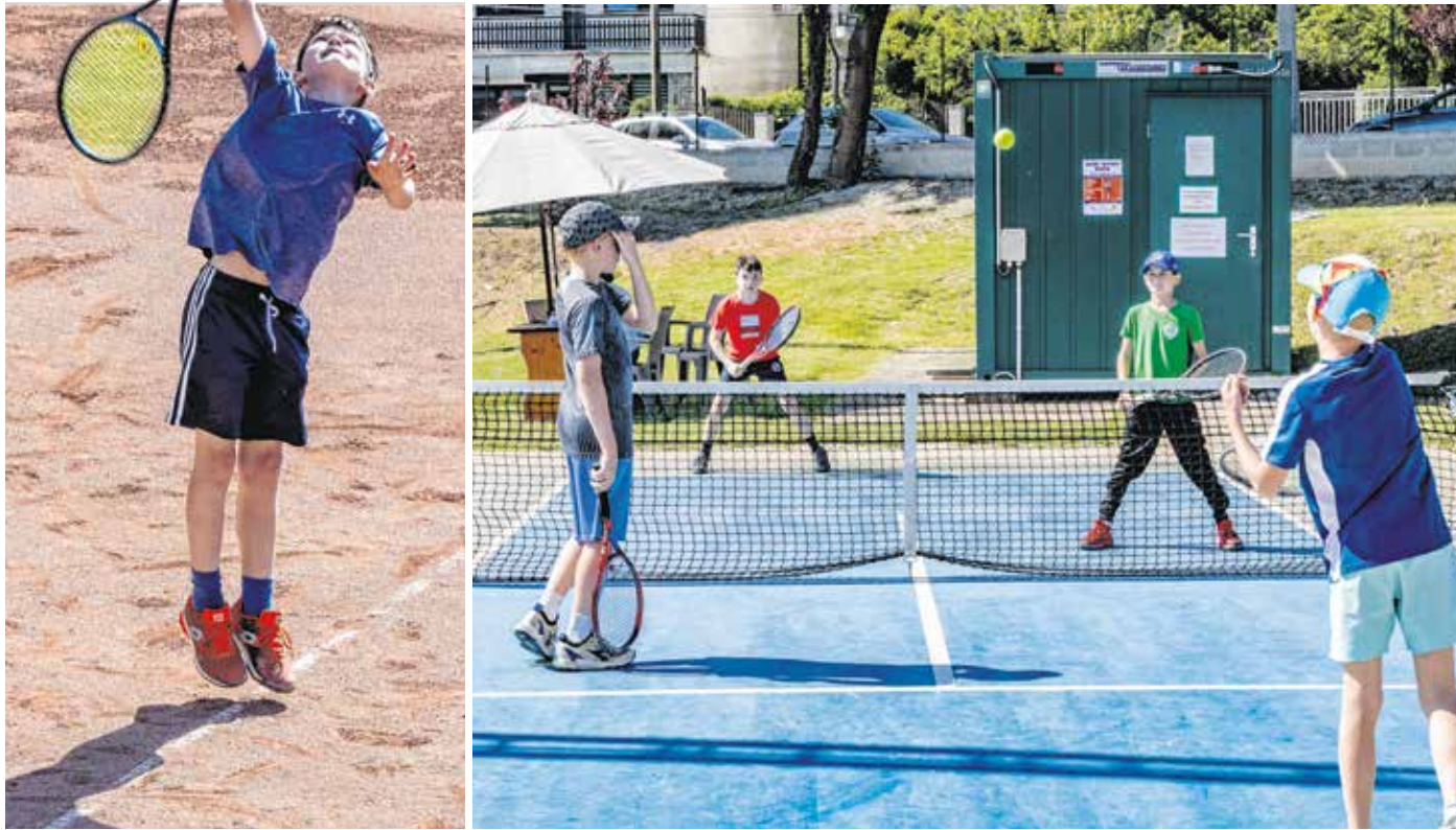
Az SVSE-GYSEV Kupán a 12 és a 16 éves korosztály legjobb teniszezői mérkőztek meg városunkban.