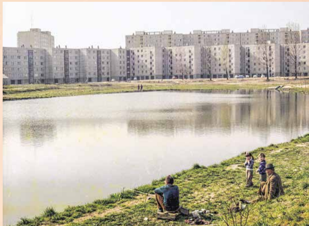
Az Ibolya-tó 1977 körül – a kezdetektől népszerű volt.

Végrehajtó Bizottsága 1971-ben határozatot hozott a Bánfalvi-galéria és az Ibolya réti kút megszüntetéséről, aztán később a Faraktári kút is bezárták. Végrehajtása 1973-ban történt, amikor a kiváltást a fertőrákosi vízmű műszaki átadásával megoldották. A Jereván városrész ivóvizét ma is a Somfalvi-galéria, a Sopron Plaza melletti szivattyúház és a bécsi-dombi víztározó biztosítja. A vízgyűjtőterület és a kutak megszüntetése még nem volt elegendő, mert a csapadékvíz elvezetéséről is gondoskodni kellett. Az elvezető csatornákat a teljes lakótelep területén ki kellett alakítani, amit egy tározótóba vezettek, ami később az Ibolya-tó nevet kapta. A tó szintjét egy zsiliptolózárral szabályozták, amin keresztül a túlsorduló víz az Ikva-patakba folyik a vezetéken keresztül. A lakótelep-építés a tó kialakításához szükséges földmunkákkal 1973. május