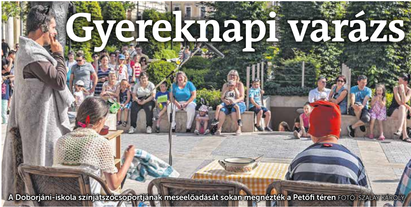
A Doborjáni-iskola színjátszócsoportjának meseelőadását sokan megnézték a Petőfi téren

Vidám hangulatban telt a hétvégi városi gyereknap. A Kodály téren az ugrólóvár mellett izgalmasak voltak a különböző bemutatók is, de a játszóház és az arcfestés sem hiányozott. Fellépett a Juventus fúvószenekar, a Drazsé együttes, a Vackor zenekar és a Pendelyes Táncgyűttes.