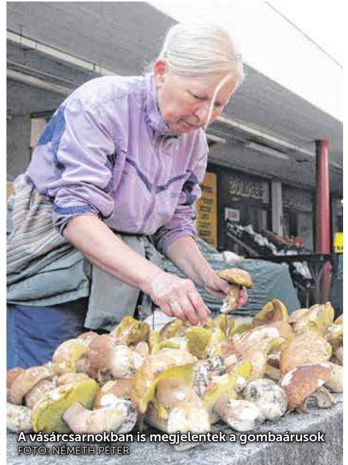
A vásárcsarnokban is megjelentek a gombaárusok

A legnépszerűbb mostanság a mezei szegfűgomba és a csiperkék, de sokan várják a nyári vargányát, ami az elmúlt egy-két hétben bukkant fel a környékbeli erdőkben. A tavaszi gombák első hírnökei a kucsmagombák és a Szent György-gomba, ezekből nem hoztak vizsgálatra idén. A sárga gévagomba, a pisztrícgomba és a tövisalagomba is ehető, viszonylag korán megjelenő faj, talán ezeket kevesebben ismerik. A mérgező fajok közül mindig a gyilkos galócát kell először kiemelni, hisz már május–június hónapban találkozhatunk vele, nagyon veszélyes, végzetes lehet az elfogyasztása. Vigyáznunk kell továbbá a susulykakkal, a döggombákkal, a kénvirággombákkal, néhány tölcsérgombafajjal, a begöngyölt szélű cölöpgombával, de a csiperkéknél is van enyhén mérgező változata.