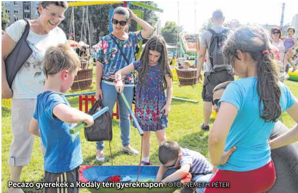
Pecázó gyerekek a Kodály téri gyereknapon