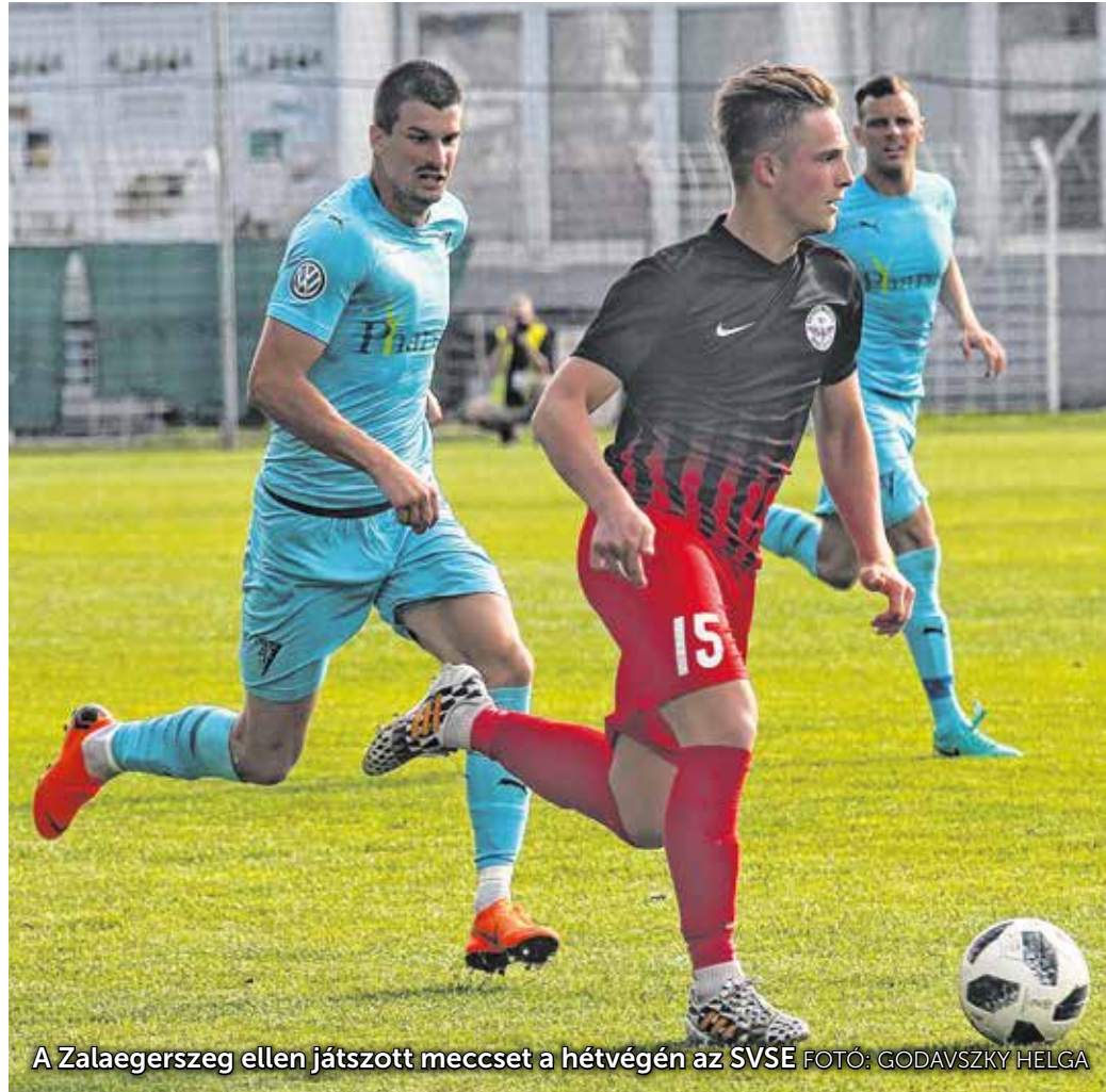
A Zalaegerszeg ellen játszott meccset a hétvégén az SVSE