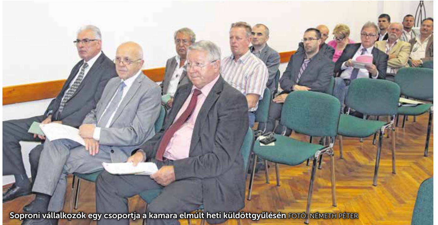
Soproni vállalkozók egy csoportja a kamara elmúlt heti küldöttgyűlésén