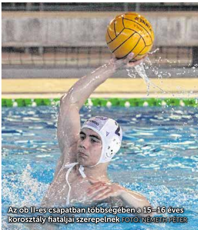
Az ob II-es csapatban többségében a 15–16 éves korosztály fiataljai szerepelnek