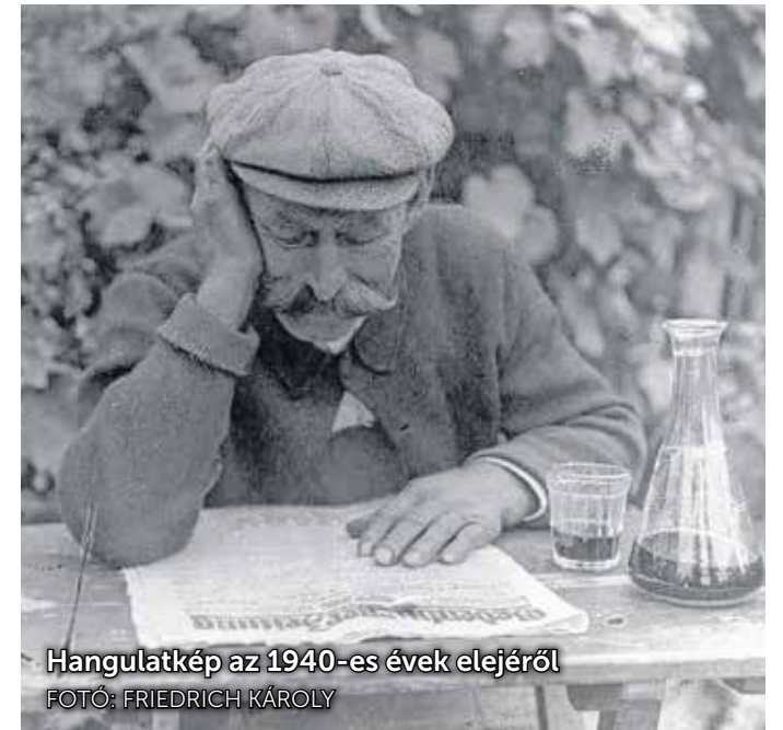
Hangulatkép az 1940-es évek elejéről

Ezt követően a rendezvény a Rejtpál-házban folytatódik, ahol a Borvirág Fúvósok zenélnék.