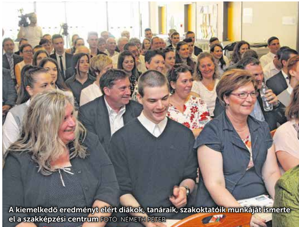
A kiemelkedő eredményt elért diákok, tanárai, szakoktatóik munkáját ismerték el a szakképzési centrumon.

A 2017/18-as tanévben a szakképzési centrum 6 tagintézményének 28 tanulója, 23 felkészítő tanárát, szakoktatóját, valamint edzőket és a gyakorlati oktatást végző vállalkozások oktatóit ismerték el kiemelkedő teljesítményükért. A diákok több országos versenyen szerepeltek, többek között a Szakma Kiváló Tanulója Versenyen, az Országos Szakiskolai Közismereti Tanulmányi Versenyeken, az ágazati szakmai érettségi vizsgatárgyak versenyén, de részt vettek az EuroSkills-en, a fiatal szakemberek Európa-bajnokságán, továbbá irodalmi és gasztronómiai versenyeken, diákolimpián is.