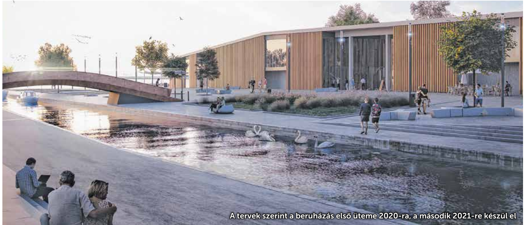
A tervek szerint a beruházás első üteme 2020-ra, a második 2021-re készül el