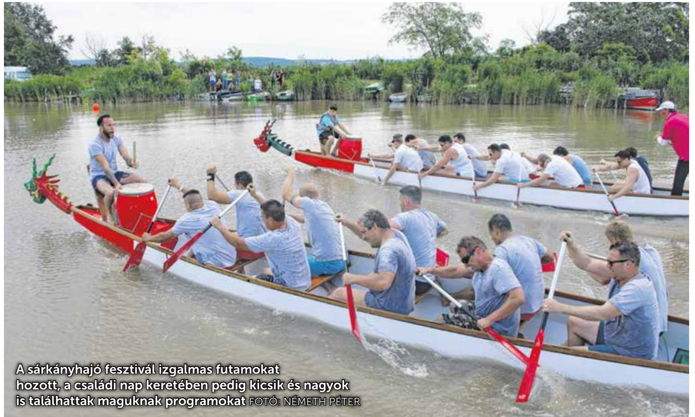
A sárkányhajó fesztivál izgalmas futamokat hozott, a családi nap keretében pedig kicsik és nagyok is találhattak maguknak programokat