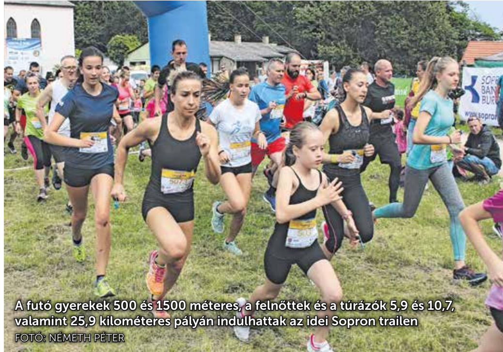
A futó gyerekek 500 és 1500 méteres, a felnőttek és a túrázók 5,9 és 10,7, valamint 25,9 kilométeres pályán indulhattak az idei Sopron trailen

– Az egész úgy indult, hogy elvégeztem egy tájfutó versenybírói képzést, így az egyesületben felkérték, hogy szervezzek egy versenyt – mesélte Takács Tibor főszervező. – Úgy gondoltam, hogy a tájfutóverseny megszervezéséhez még nincs elég tapasztalatom, ezért inkább nekiláttam egy terepfutó versenynek. Szerencsém volt, mert akinek elmeséltem az ötletemet, azok támogattak, illetve már ők is