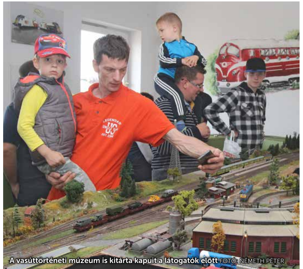
A vasúttörténeti múzeum is kitérte kapuit a látogatók előtt