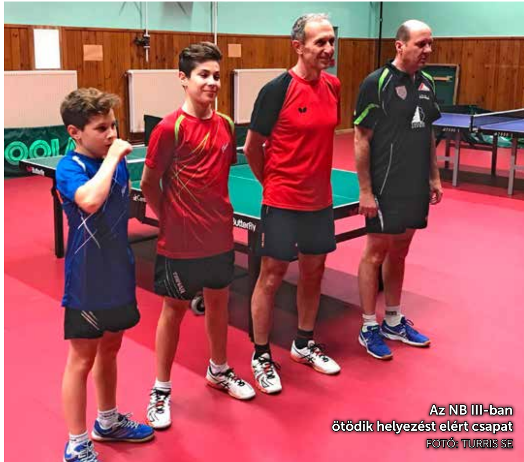
Az NB III-ban ötödik helyezést elért csapat