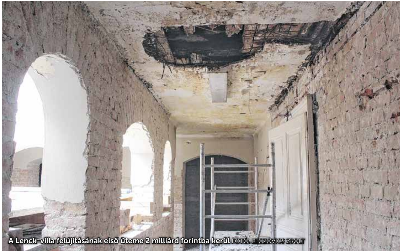
A Lenck-villa felújításának első üteme 2 milliárd forintba kerül