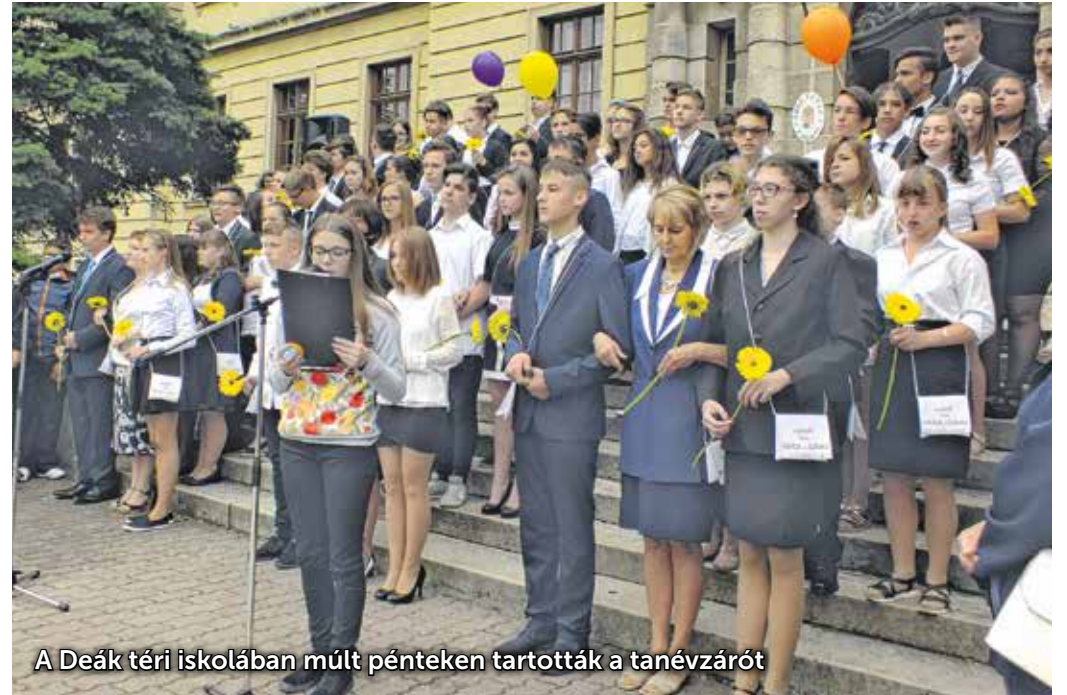
A Deák téri iskolában múlt pénteken tartották a tanévzárót

A Hunyadi János Evangélikus Óvoda és Iskola tanévzáró