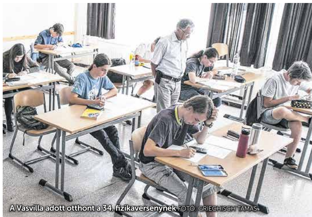
A Vasvilla adott otthont a 34. fizikaversenynek