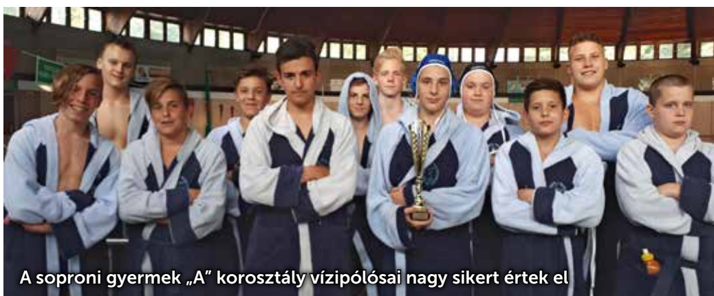
A soproni gyermek „A” korosztály vízipólósai nagy sikert értek el

Ezüstérmet szerzett a Soproni Vízilabda Sport Egyesület a Dunántúli Vízilabda Liga gyermek „A” korosztályában. Városunk csapata nagy küzdelemben, csupán rosszabb gólkülönbsége miatt csúszott le a bajnoki címről.