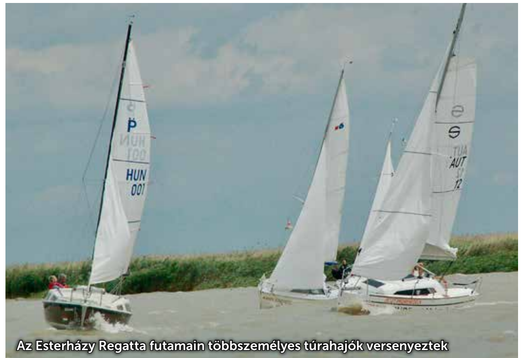
Az Esterházy Regatta futamain többszemélyes túrahajók versenyeztek