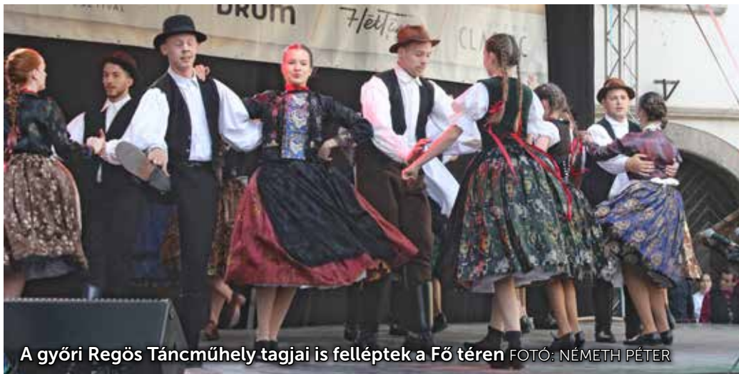
A győri Regös Táncműhely tagjai is felléptek a Fő téren

A több mint két évtizedes múlttal rendelkező Soproni Néptánccsoporthoz 2018-ban is színvonalas produkciókkal, népzenei és világzenei koncertekkel várta az érdeklődőket a belvárosban az elmúlt hétvégén.