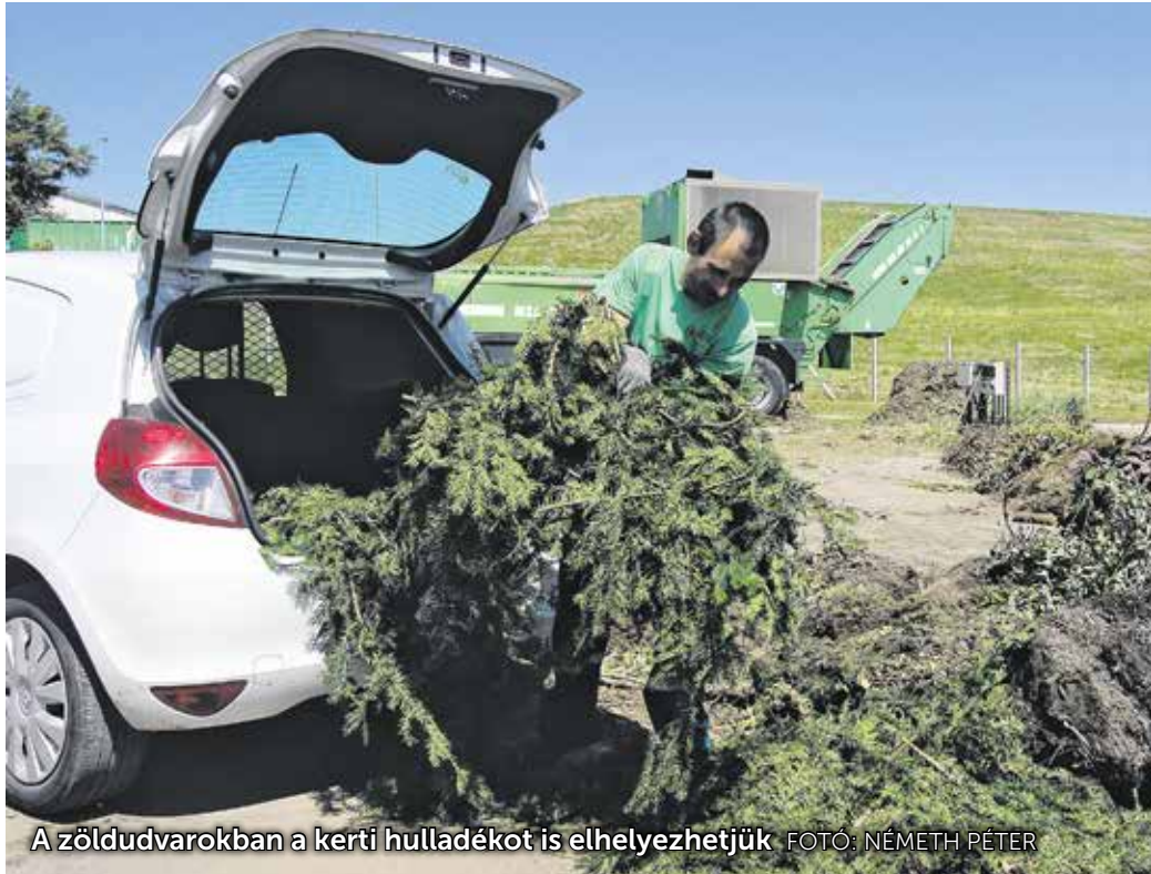
A zöldudvarokban a kerti hulladékot is elhelyezhetjük.