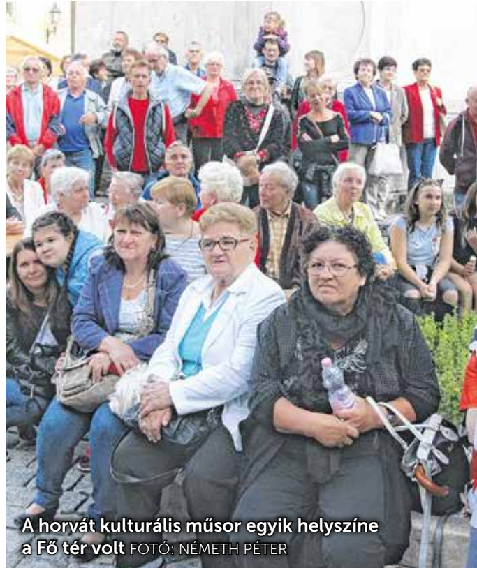
A horvát kulturális műsor egyik helyszíne a Fő tér volt

A kulturális programokon a soproni és kópházi együttesek mellett a Horvátországból érkezett csoportok is felléptek.