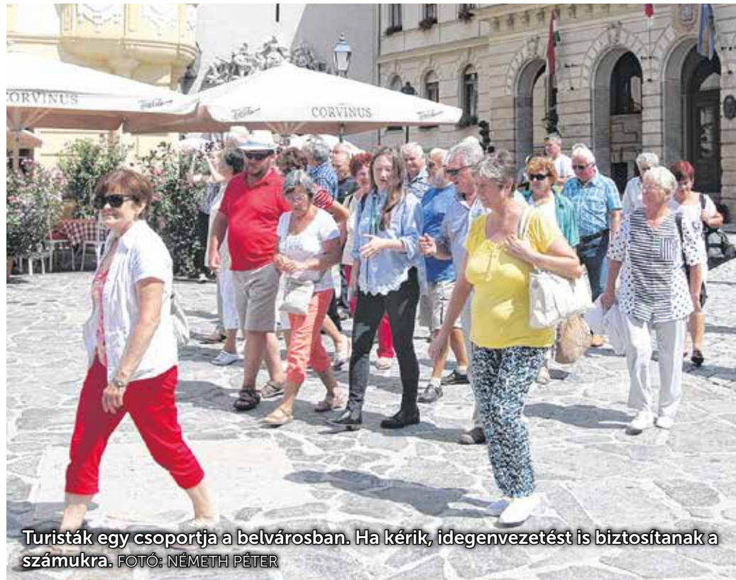
Turisták egy csoportja a belvárosban. Ha kéri, idegenvezetést is biztosítanak a számukra.