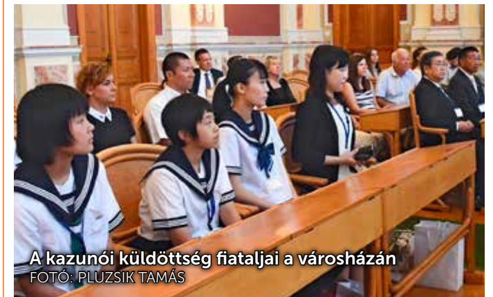
A kazunói küldöttség fiataljai a városházán