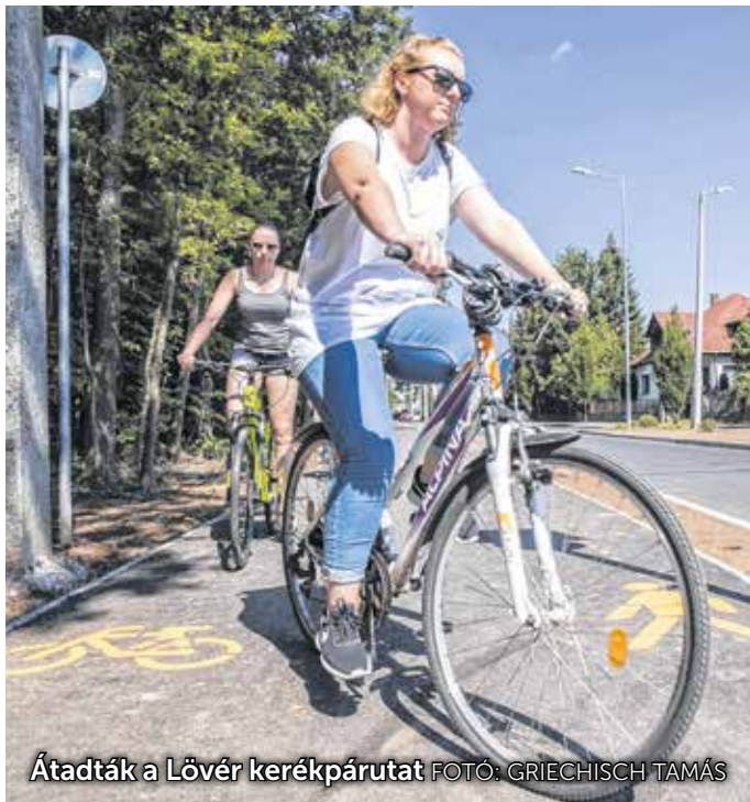
Átadták a Lövér kerékpárutat