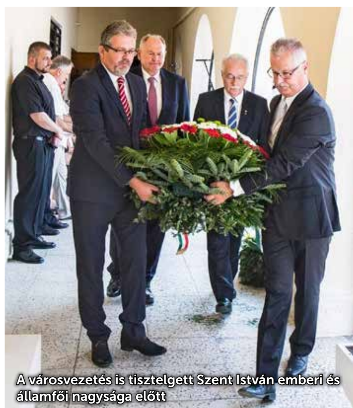
A városvezetés is tisztelgett Szent István emberi és államfői nagysága előtt.