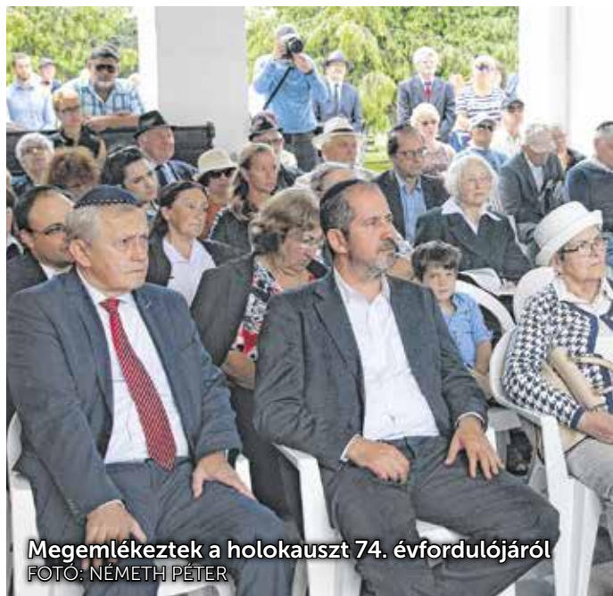
Megemlékeztek a holokauszt 74. évfordulójáról

1944. május 20-ig a Jakobi-féle gyárban helyezték el 250 embert. A zsidók összegyűjtését az Új utcában és a Papréten június 5-én fejezték be. A városból 1857 személyt szállítottak el az auschwitzi haláltáborba, közülük mindössze 325-en tértek vissza.