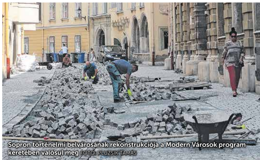
Sopron történelmi belvárosának rekonstrukciója a Modern Városok program keretében valósul meg.