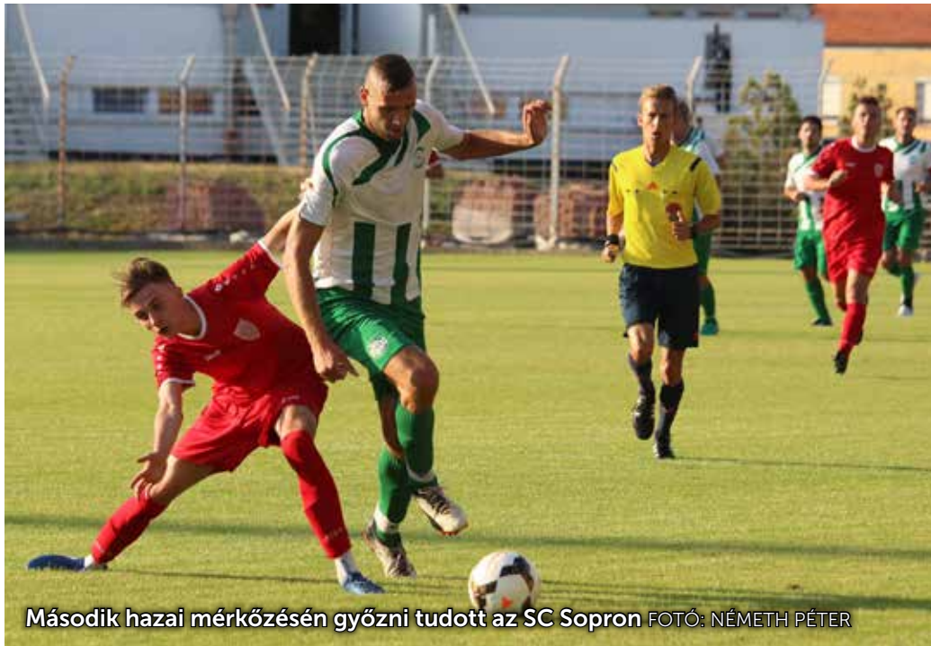
Második hazai mérkőzésén győzni tudott az SC Sopron