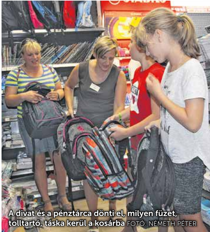
A divat és a pénztárca dönti el, milyen füzet, tolltartó, táska kerül a kosárba

Az eladó inkább a hagyományos mintájú táskákat – fiúknak focis, motoros, autós, lányoknak lovas, sünis, madaras, farmermintás – ajánlja, ezeknél ugyanis kevésbé merül fel a lehetőség annak, hogy kimennek