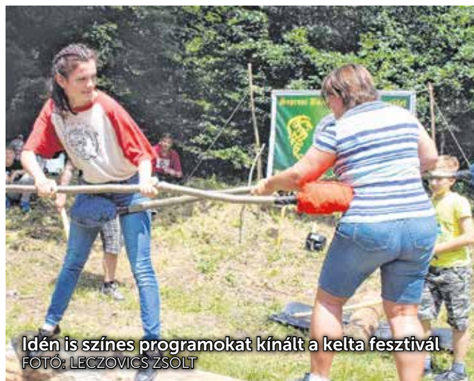
Idén is színes programokat kínált a kelta fesztivál.

Fertődön, a kiindulóponton adták át az újonnan kitáblázott kerékpárosútvonalat. Révész Máriusz, az Aktív Magyarországért felelős kormánybiztos elmondta, a fejlesztés példaértékű, hiszen a Nemzeti Fejlesztési Minisztérium civil kezdeményezést támogatott. Magyar-