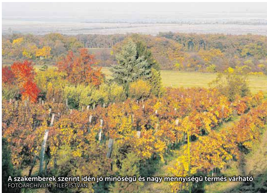
A szakemberek szerint idén jó minőségű és nagy mennyiségű termés várható