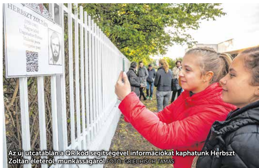
Az új utcatáblán a QR kód segítségével információkat kaphatunk Herbszt Zoltán életéről, munkásságáról