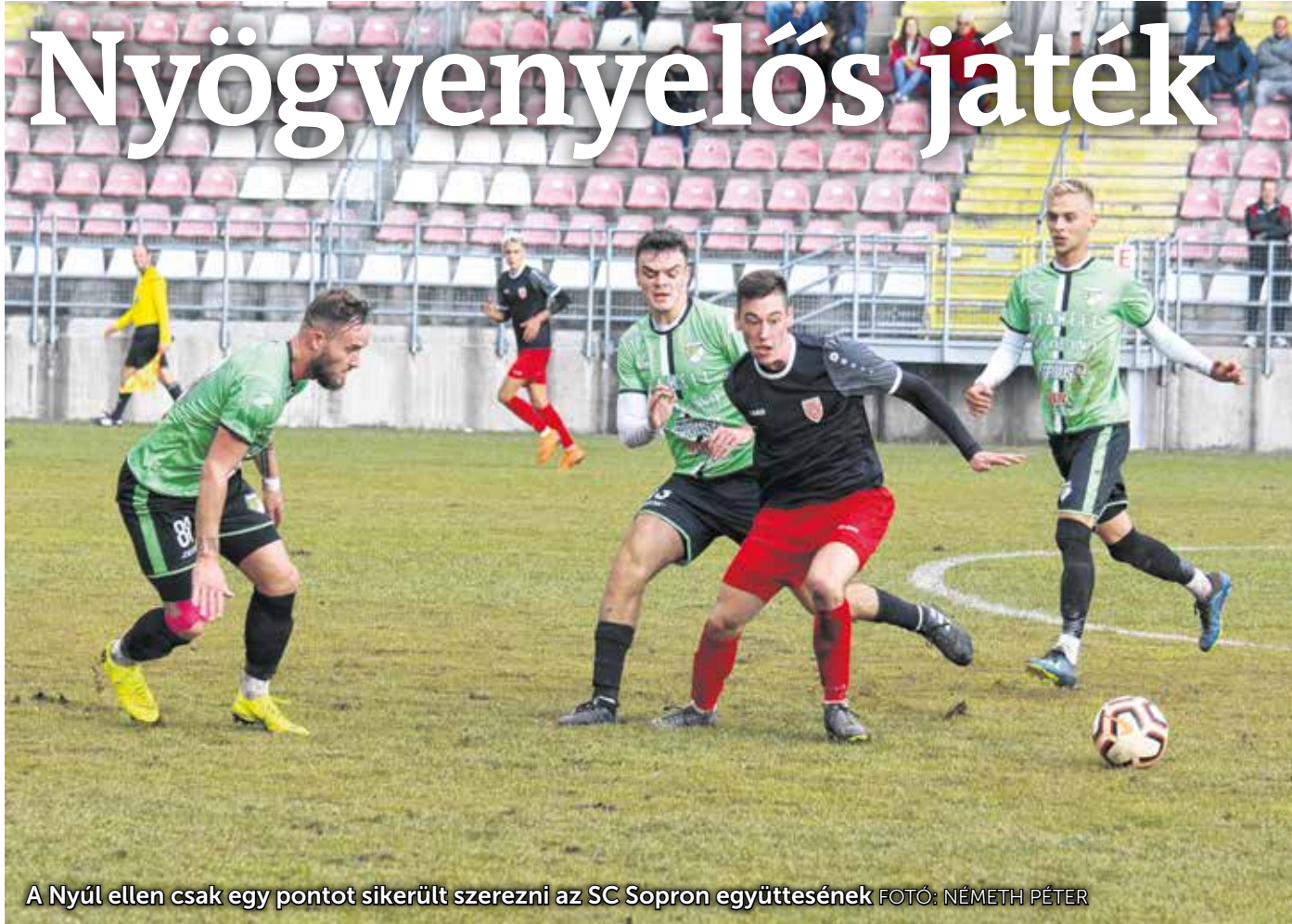
A Nyúl ellen csak egy pontot sikerült szerezni az SC Sopron együttesének