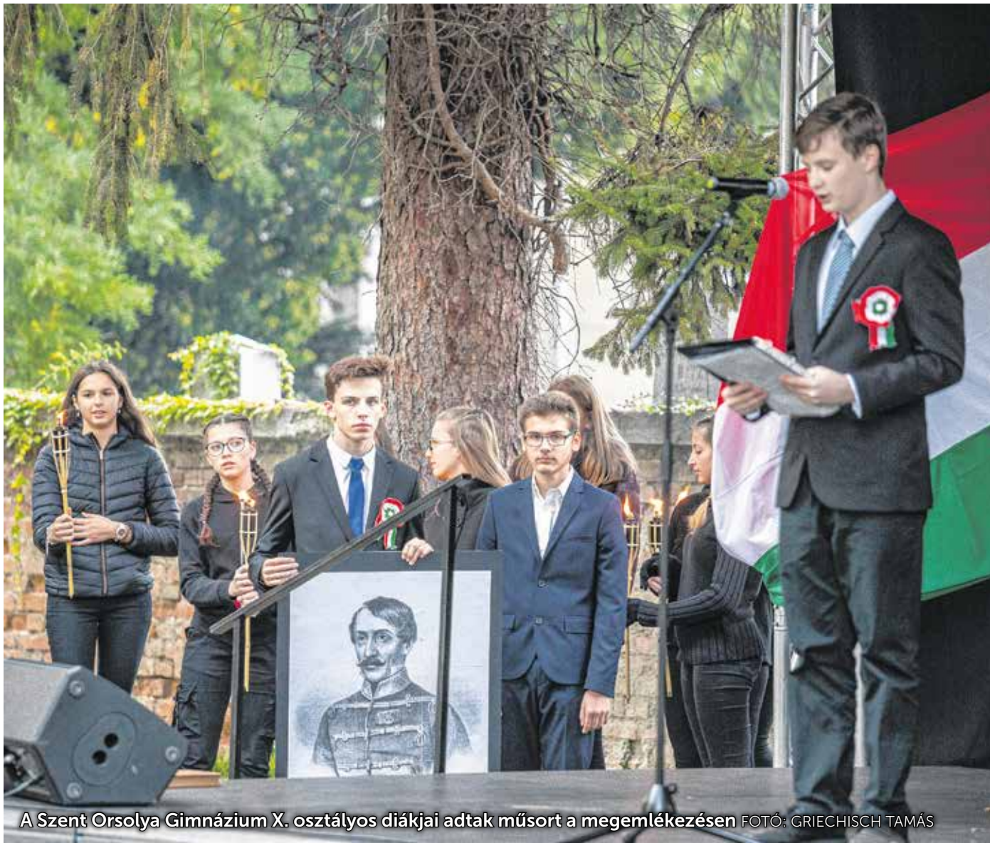
A Szent Orsolya Gimnázium X. osztályos diákjai adtak műsort a megemlékezésen