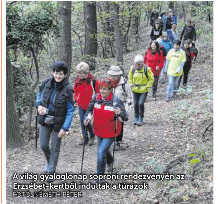
A világ gyaloglónap soproni rendezvényén az Erzsébet-kertből indultak a túrázók