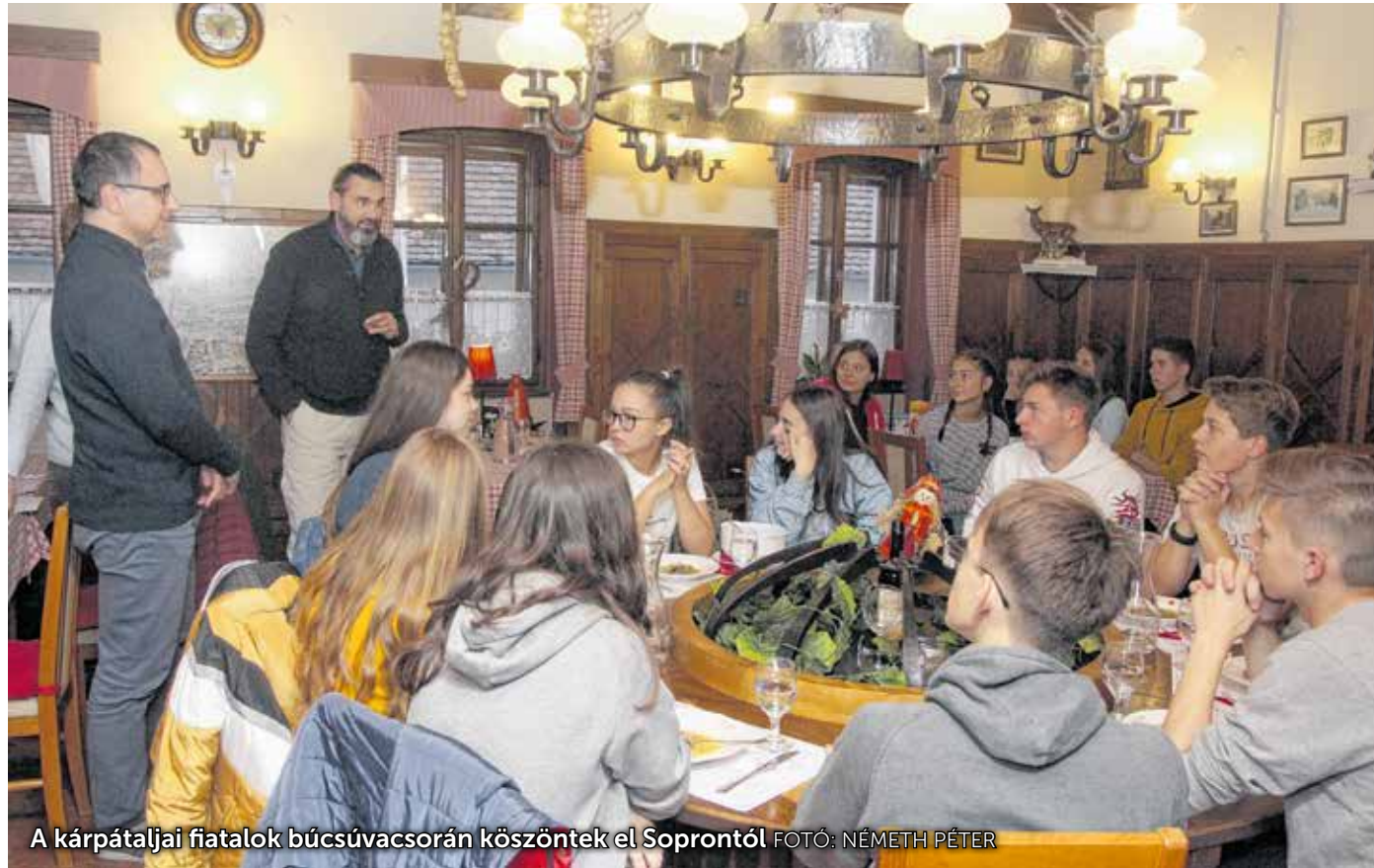
A kárpátaljai fiatalok búcsúvacsorán köszöntek el Soprontól.

– A legnagyobb öröm az volt számomra Magyarországon, hogy az anyanyelvemen beszélhettem, és az utcai feliratokat is megértettem – mesélte Halász