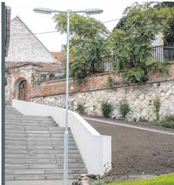
Megújul az Úszoda utcát és az Ösvény utcát összekötő lépcső.