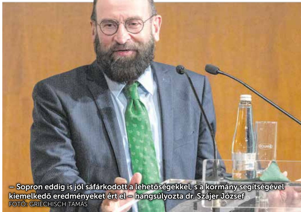
Sopron eddig is jól sáfárkodott a lehetőségekkel, s a kormány segítségével kiemelkedő eredményeket ért el – hangsúlyozta dr. Szájer József

A képviselő elmondta, a GDP növekedése teszi lehetővé, hogy több jusson a családoknak, hogy kiemelten támogassák a gyermeknevelést, hogy folyamatosan emelkedhetnek a bérek, hogy minden megyei jogú várost bekötnék az autópálya-hálózatba, hogy több pénz jut az önkormányzatoknak. Az erősödő gazdaság teszi lehetővé a települések modernizációs programját is. A Modern Városok Program 2015-ben éppen Sopronból indult, s ma már konkrét eredményekről beszélhetünk.