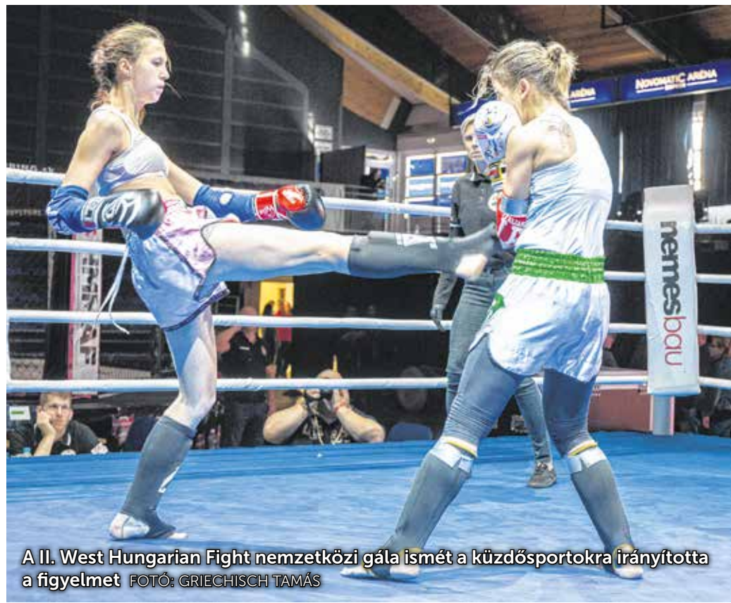
A II. West Hungarian Fight nemzetközi gála ismét a küzdősportokra irányította a figyelmet