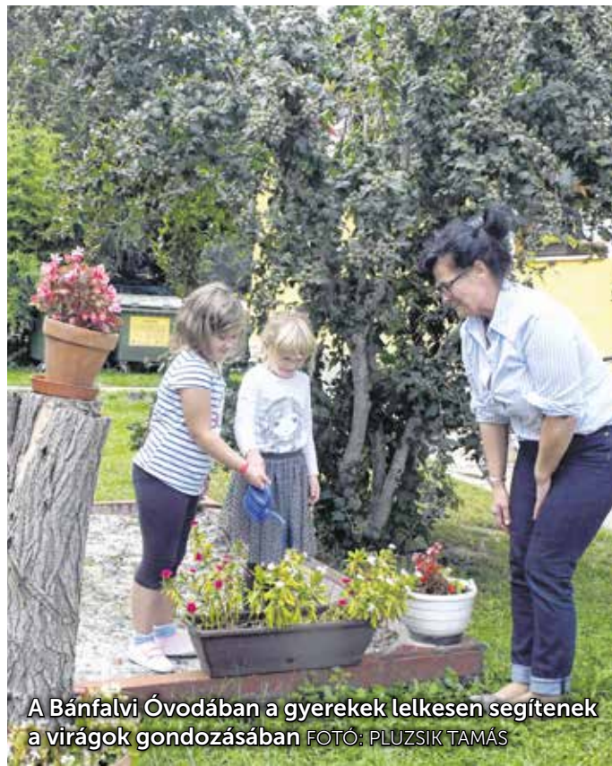
A Bánfalvi Óvodában a gyerekek lelkesen segítenek a virágok gondozásában

Ott létünk is láthatjuk, hogy az óvodások körében a legnépszerűbb feladat a locsolás. Szinte versengnek érte a kis-lányok és a kisfiúk, hogy locsolókannáikkal ki, mikor, melyik növényt itathatja meg.