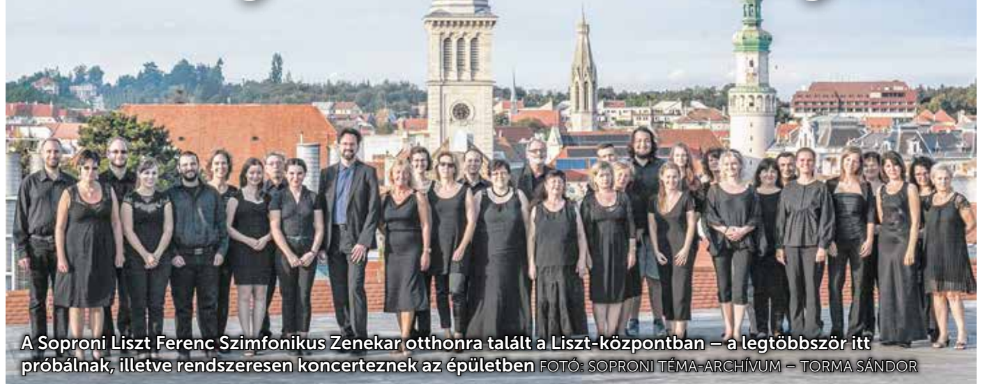
A Soproni Liszt Ferenc Szimfonikus Zenekar otthonra talált a Liszt-központban – a legtöbbször itt próbálnak, illetve rendszeresen koncerteznek az épületben