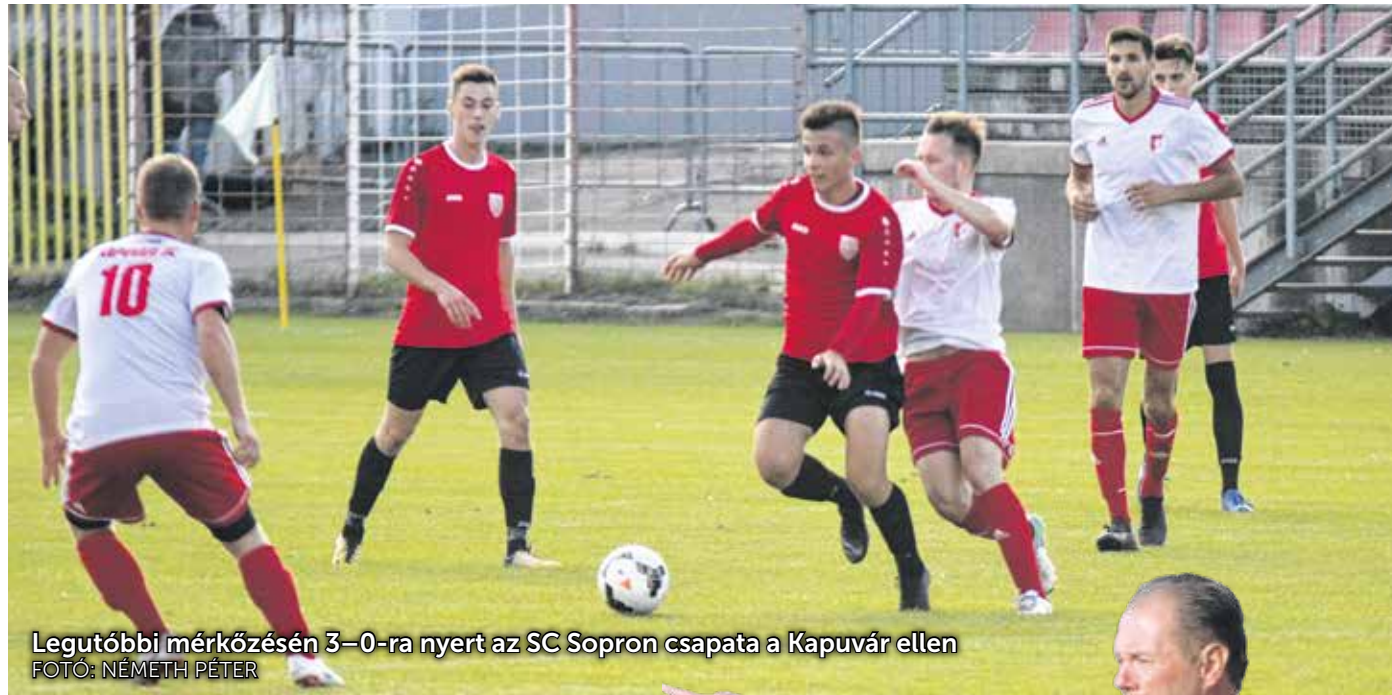
Legutóbbi mérkőzésén 3–0-ra nyert az SC Sopron csapata a Kapuvár ellen