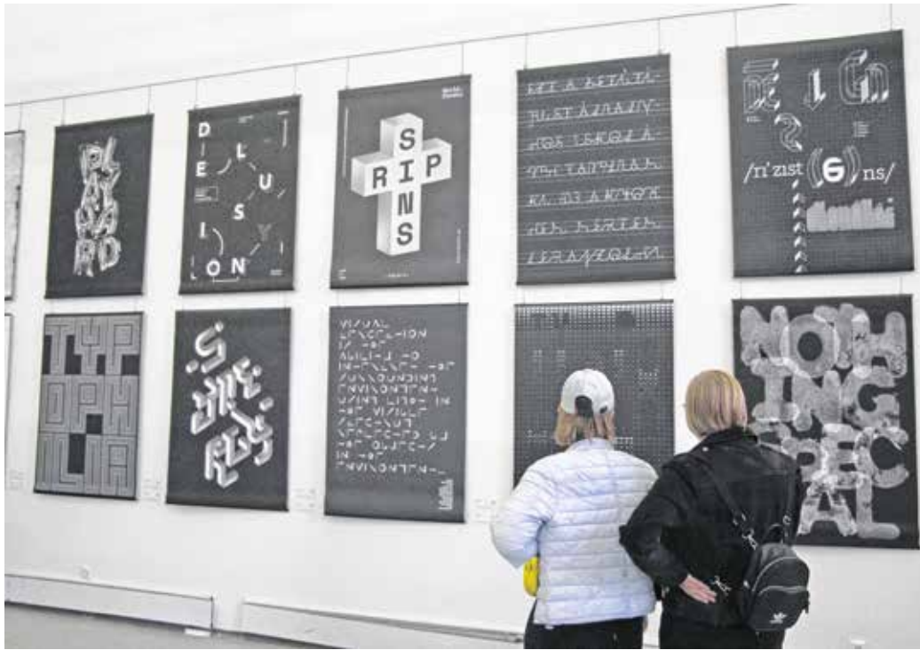
A Typozóna/2 című kiállítással vette kezdetét a designhét