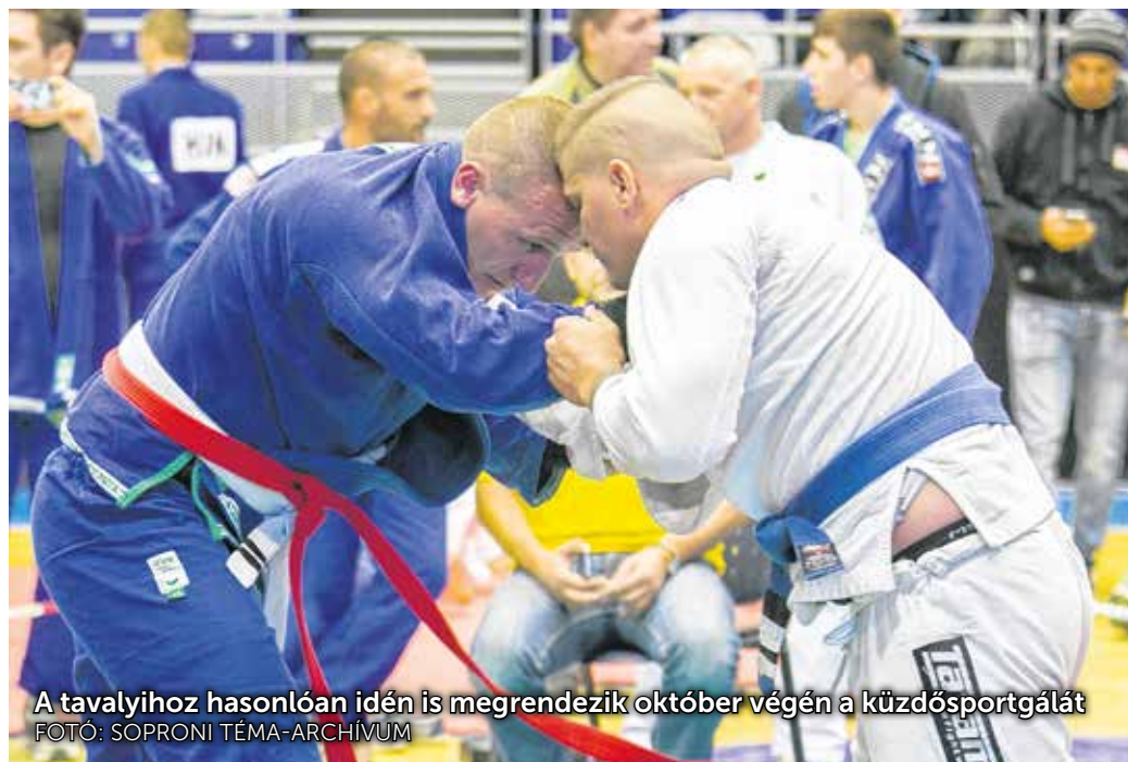
A tavalyihoz hasonlóan idén is megrendezik október végén a küzdősportgálát