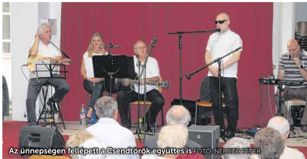
Az ünnepségen fellépett a Csendtörők együttes is

Október a látás hónapja, 15-e pedig a fehér bot napja már több mint 45 éve, amelyhez kapcsolódóan Sopronban a Vakok és Gyengénlátók Egyesülete tartott összejövetelt szombaton a Soproni Egyetem Lámfalussy-karának aulájában.