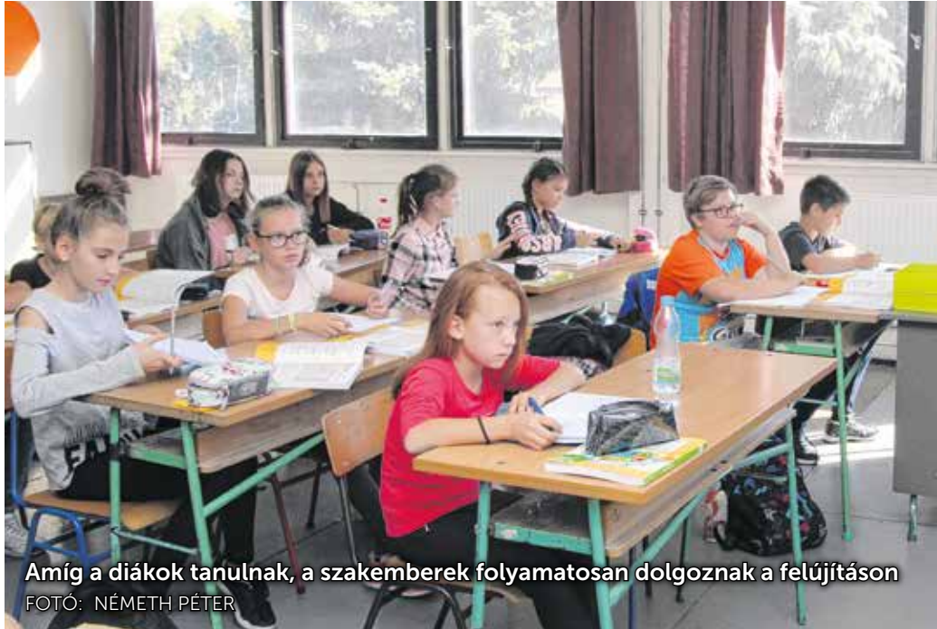
Amíg a diákok tanulnak, a szakemberek folyamatosan dolgoznak a felújításon

– A városban már elkezdődött az intézmények felújítása, s ennek az egyik állomása a Lackner-iskola korszerűsítése – mondta el dr. Fodor Tamás. – Az 1977-ben átadott intézményben korábban átfogó rekonstrukció nem volt, így időszerűvé vált a korszerűsítés. Ennek során hőszigetelik a homlokzatot, kicserélik az intézmény nyílászáróit, felújítják a tetőt és a fűtési rendszert is. 2018 a családok éve, azaz nem mindegy, hogy a gyerekek milyen szolgáltatást nyújtó intézménybe járnak. A Lackner-iskola komfortosabb lesz, s a fenntartási költségek is csökkennek.