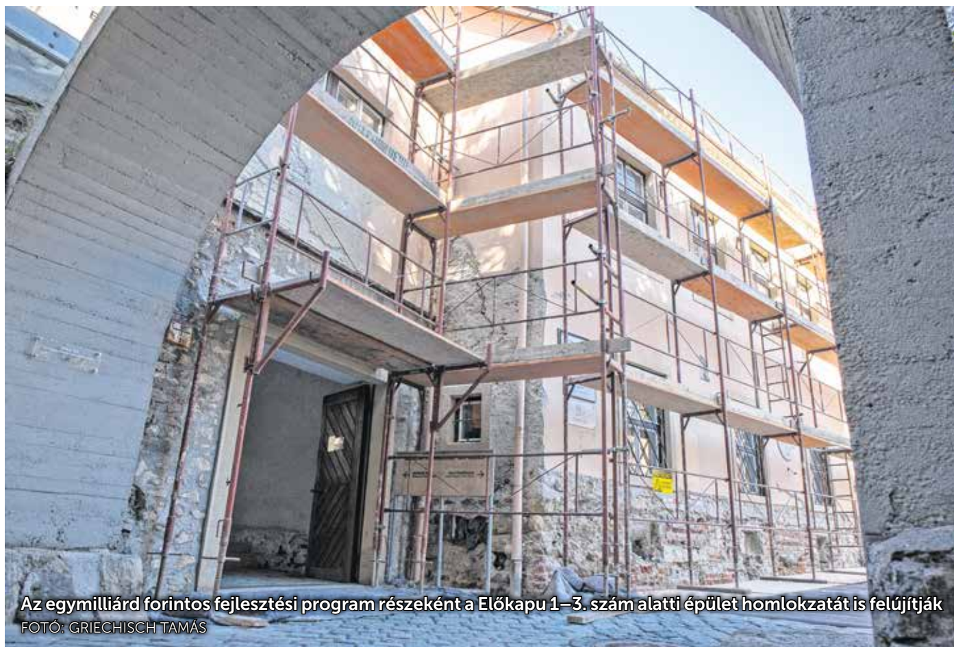
Az egymilliárd forintos fejlesztési program részeként a Előkapu 1–3. szám alatti épület homlokzatát is felújítják