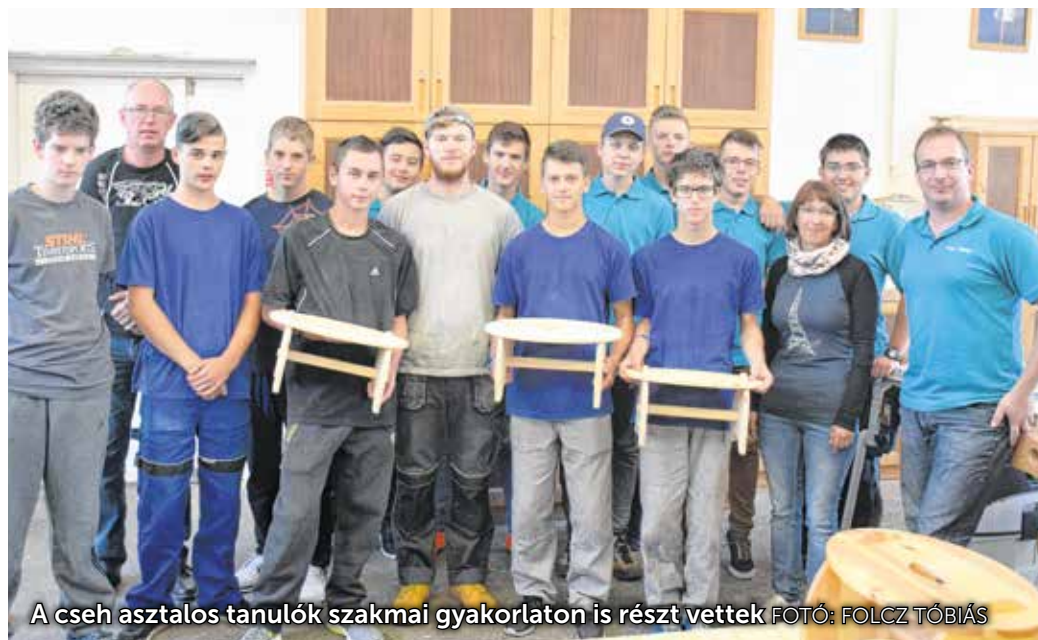
A cseh asztalos tanulók szakmai gyakorlaton is részt vettek

A csehországi kisváros, Slavkov u Brna egyik szakképző iskolája két évvel ezelőtt cserekapcsolatot ajánlott fel a soproni Handler-iskola vezetésének. A hasonló képzési területeken működő két intézmény azóta