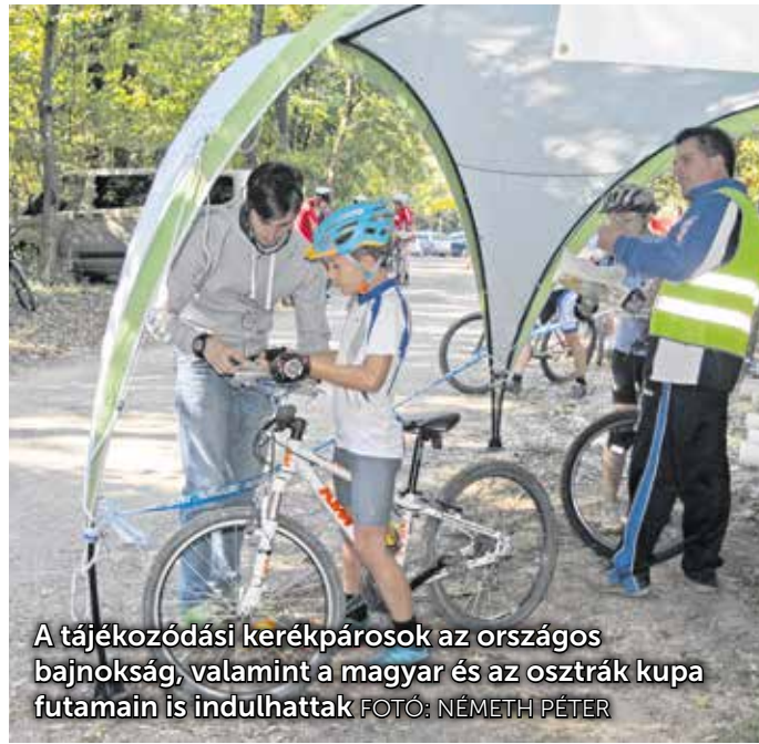
A tájkerékpárosok az országos bajnokság, valamint a magyar és az osztrák kupa futamain is indulhattak.