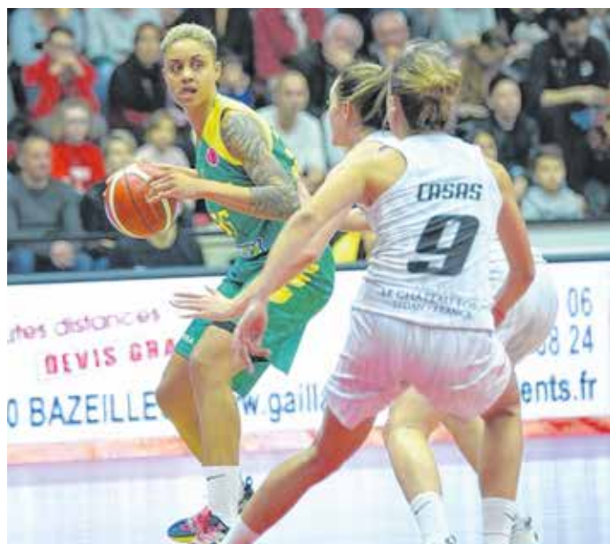
A Sopron Basket vereséggel kezdte az Euroliga-szereplését (felvételünkön), de a bajnokságban a Szekszárd otthonában tudott győzni.

Múlt héten megkezdte nemzetközi szereplését is a Sopron Basket, a csapat Franciaországban lépett először parkettre az Euroligában. A Flammes Carolo Basket elleni meccsen két negyedben keresztül egálra állt a találkozó, a harmadik etapban azonban jelentősebb különbség alakult ki a hazaiak javára. Innen még négy pontra visszakapaszkodott a Sopron Basket, de a győzelmet a francia együttes szerezte meg – köszönhetően a szokásosnál jóval több soproni hibának és a 19 eladott labdának. A