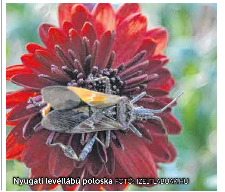
Nyugati levéllábú poloska

Mint azt Szita Renátától, a Fertő–Hanság Nemzeti Park biológusától megtudtuk, napjainkban három idegenhonos poloskafaj inváziójával nézünk szembe Magyarországon, ám az emberi egészségre egyikük sem veszélyes. Áttekintve azonban komolyabb károkat okozhatnak a szántóföldi növényekben, a gyümölcsösökben, a zöldségesekben, emiatt is fontos a védekezés. A kereskedelemben kapható rovarirtószereket is használhatjuk, ám az is eredményes, ha a poloskákat, harlekinkaticákat öszszeporszívózzuk és elégetjük – javasolta a szakember.