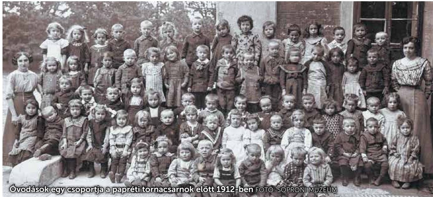
Óvodások egy csoportja a papréti tornacsarnok előtt 1912-ben

A következő évben a Pozsonyi Hírnök 1838. november 22-i száma már az Halász utcában megépített új intézmény