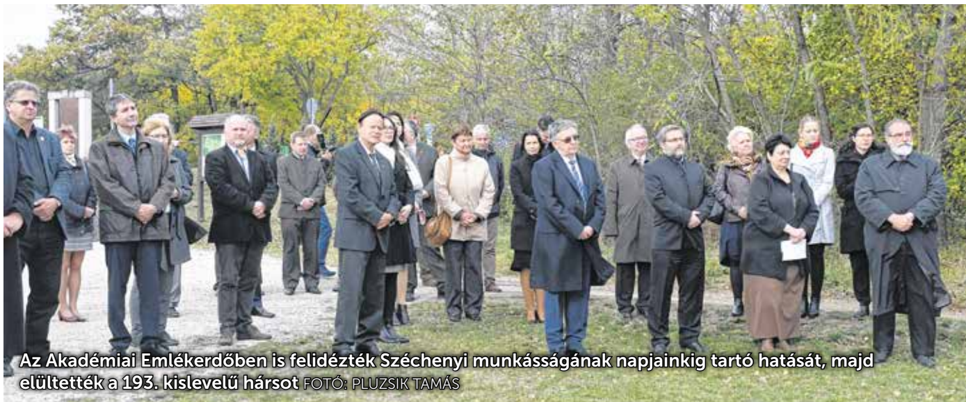
Az Akadémiai Emlékerdőben is felidéztek Széchenyi munkásságának napjainkig tartó hatását, majd elültették a 193. kislevelű hársot