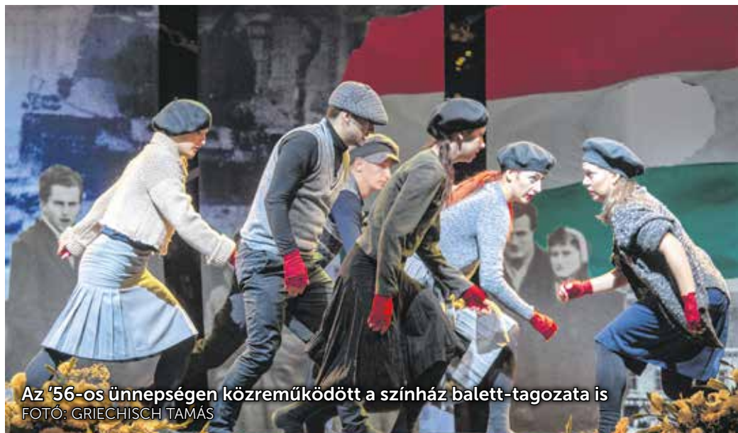
Az '56-os ünnepségen közreműködött a színház balett-tagozata is