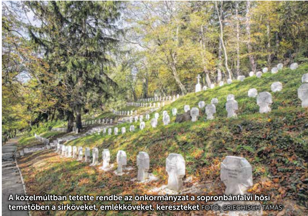
A közelmúltban tetette rendbe az önkormányzat a sopronbánfalvi hősi temetőben a sírköveket, emlékköveket, keresztekét

A hősi temető története 1878-ig nyúlik vissza, akkoriban a városban állomásozó és betegségben elhunyt katonákat temették ide. Nagy fordulatot hozott az első világháború. Több katonai kórházat is nyitottak Sopronban, hiszen a frontokról rendszeresen érkeztek