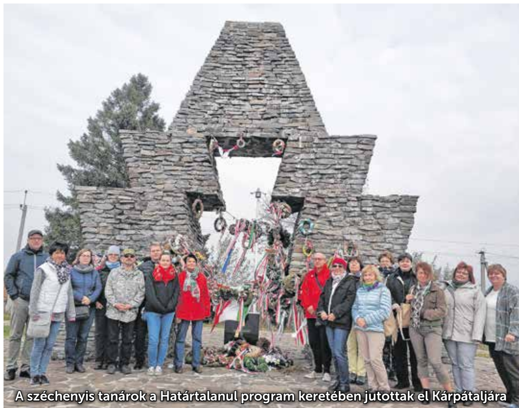
A széchenyi tanárok a Határtalanul program keretében jutottak el Kárpátaljára

A Széchenyi István Városi Könyvtár internetes oldalán (www.szivk.hu) megtalálható adatbázisból közöl részleteket lapunk.