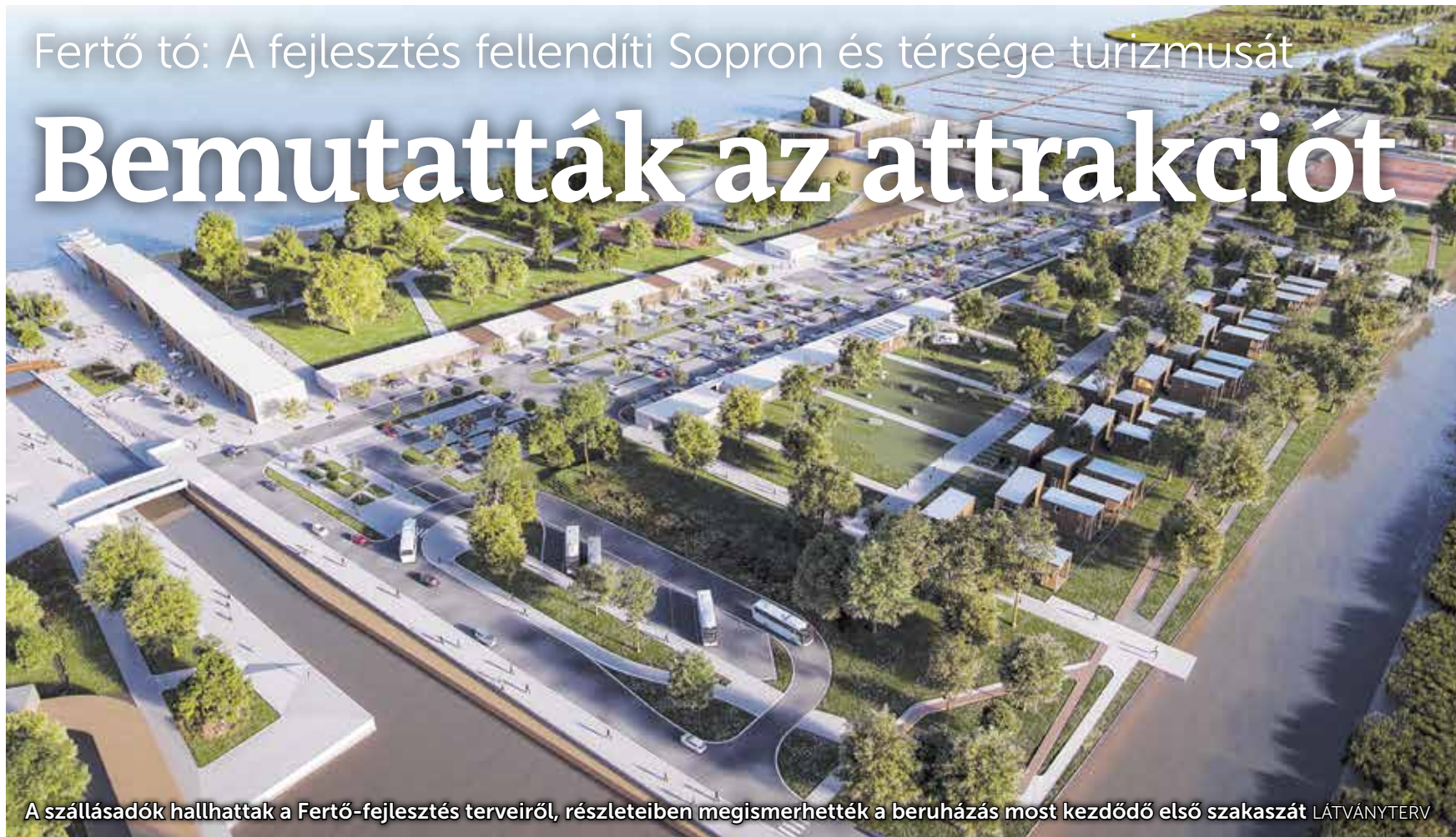
A szállásadók hallhatták a Fertő-fejlesztés terveiről, részleteiben megismerhették a beruházás most kezdődő első szakaszát LÁTVÁNYTERV