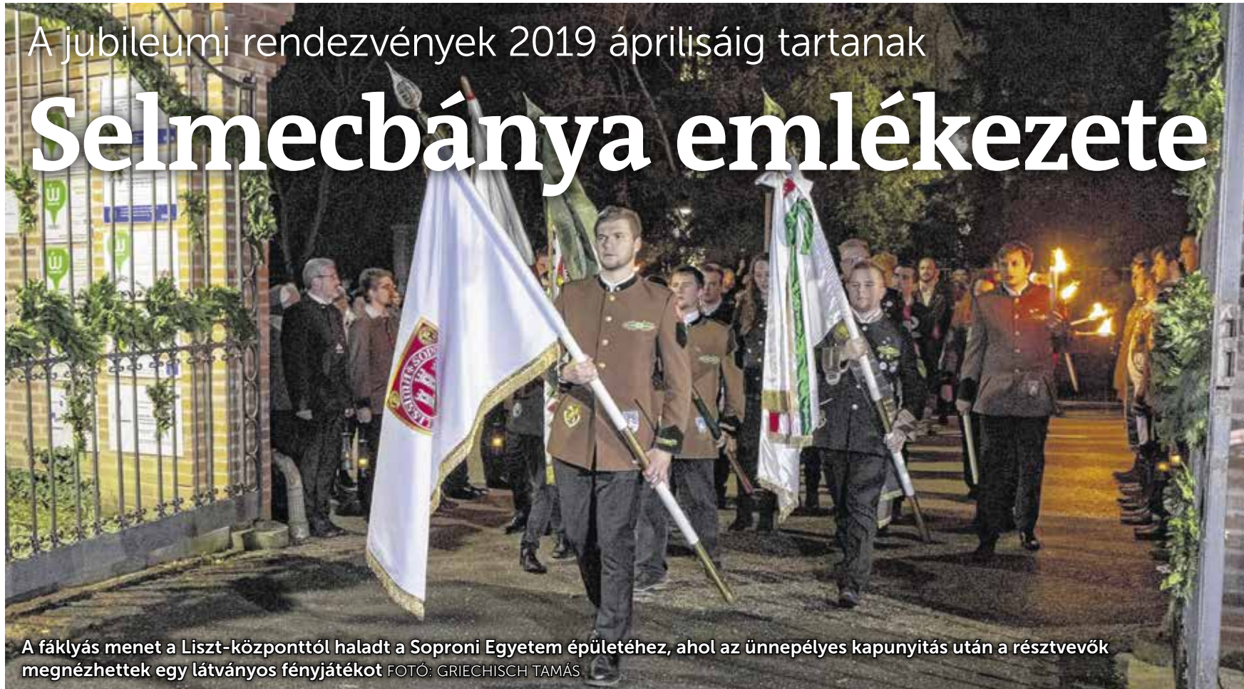
A fáklyás menet a Liszt-központtól haladt a Soproni Egyetem épületéhez, ahol az ünnepélyes kapunyitás után a résztvevők megnézhettek egy látványos fényjátékot

Rengeteg öregdiák, mostani hallgató, valamint oktatók és a városvezetés idézte fel a Magyar Királyi Bányászati és Erdészeti Főiskola Sopronba költözésének történetét. A századik évfordulón a Liszt-központban tartottak megemlékezést.