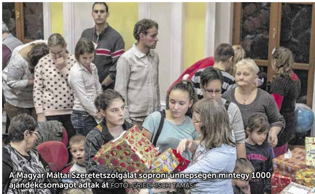
A Magyar Máltai Szeretetszolgálat soproni ünnepségén mintegy 1000 ajándéksomagot adtak át