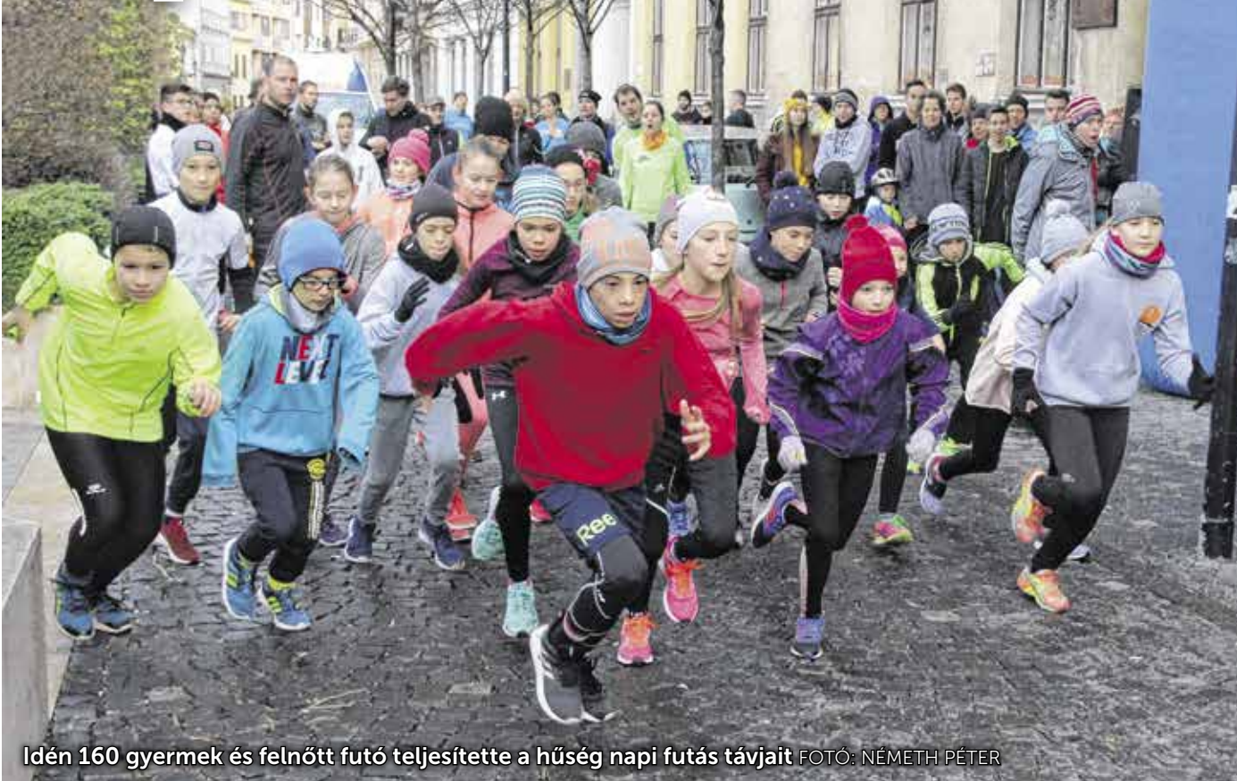
Idén 160 gyermek és felnőtt futó teljesítette a hűség napi futás távjait

A sportfelügyelet szervezésében idén is mozgással emlékeztek meg a hűség napjáról Sopronban. Múlt vasárnap a Petőfi térről indult el a népes mezőny, a futók két táv (1,2 és 3,5 kilométer) közül választhattak.