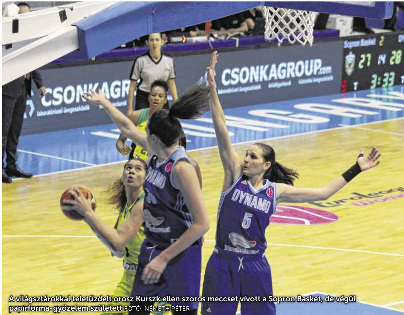
A világsztárokkal teletűzdelt orosz Kurszk ellen szoros meccset vívott a Sopron Basket, de végül papírforma-győzelem született

A fantasztikus salamancai bravúrgyőzelem után hazai pályán még nehezebb feladat várt Roberto Iniguez tanítványaira: a „világválogatottnak” is beillő orosz sztár csapat, a Dinamo Kurszk látogatott a leghűsebb városba. A soproni csapatnak nem ment olyan jól a játék, mint Spanyolországban, az elején el is húztak az oroszok, azonban a focsikorgatva küzdő, minden labdáért keményen harcoló soproni hölgyek egalizálni tudtak, szünetben egy ponttal vezettek is (32–31). Fordulás után folytatódott a pontszegény, küzdelmes játék, a Sopron Basket óriási energiákat fordított a védekezésre. Emiatt azonban az utolsó etapban már a fáradtság jelei mutatkoztak a lányokon, ezt pedig az