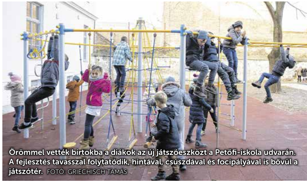
Örömmel vették birtokba a diákok az új játszótérrel a Petőfi-iskola udvarán. A fejlesztés tavasszal folytatódik, hintával, csúszdával és focipályával is bővül a játszótér.