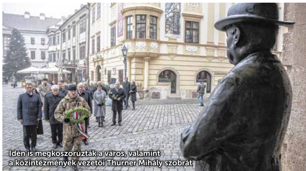
Idén is megkoszorúzták a várost, valamint a köztisztviselők vezetői Thurner Mihály szobrát