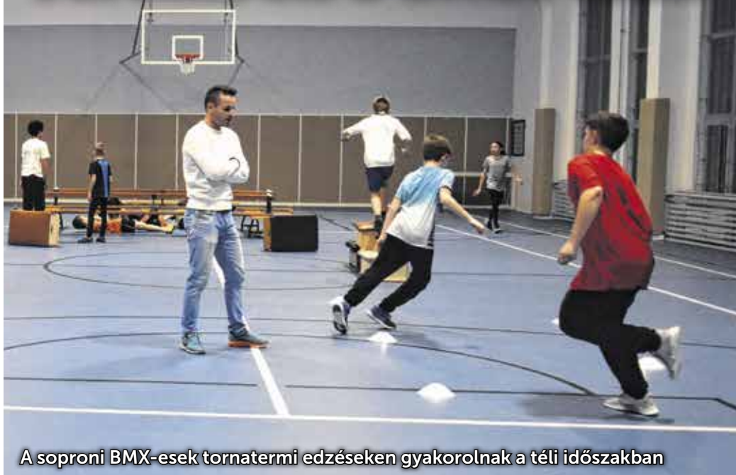
A soproni BMX-esek tornatermi edzéseken gyakorolnak a téli időszakban

November óta tornatermi edzésekkel tartják formában magukat a GYSEV Sopron BMX SE csapatának tagjai. Amíg az időjárás engedte, szabadtéri futógyakorlatok, valamint akadályokkal nehezített pályán végzett feladatok is szerepeltek a programban. Jelenleg heti három alkalommal egyórás edzésen vesznek részt a bringások, a foglalkozásokat az SVSE Sporttelep csarnokában tartják.