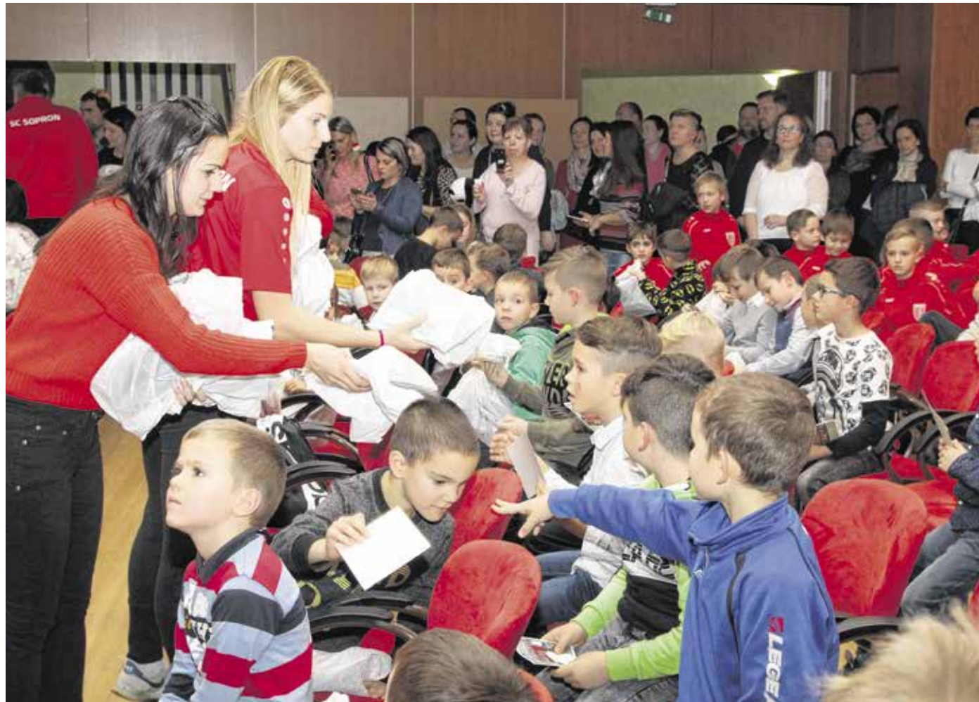
Az egyesület karácsonyi évzáróján a fiatal sportolók az elismerő szavak mellett ajándékokat is kaptak

– Az utánpótlás kérdése az egyik legnagyobb szakmai kihívás manapság szakmában – mondotta Csizsár Ákos, az SC Sopron elnöke. – Nagyon jó látni, hogy idén is sok gyermek csatlakozott az SC Sopronhoz.