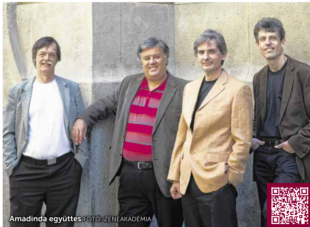
Amadinda együttes

– Ha engem kérdez, a mérlegünk egyértelműen pozitív. Ennyi időt eltölteni úgy, hogy a közönség szeretete még ma is tapintható, egészen rendkívüli érzés.