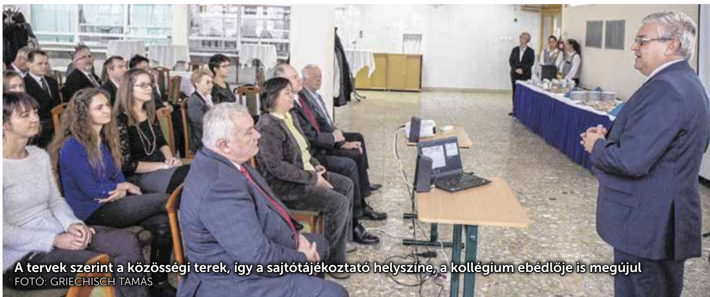
A tervek szerint a közösségi terek, így a sajtótájékoztató helyszíne, a kollégium ebédlője is megújul