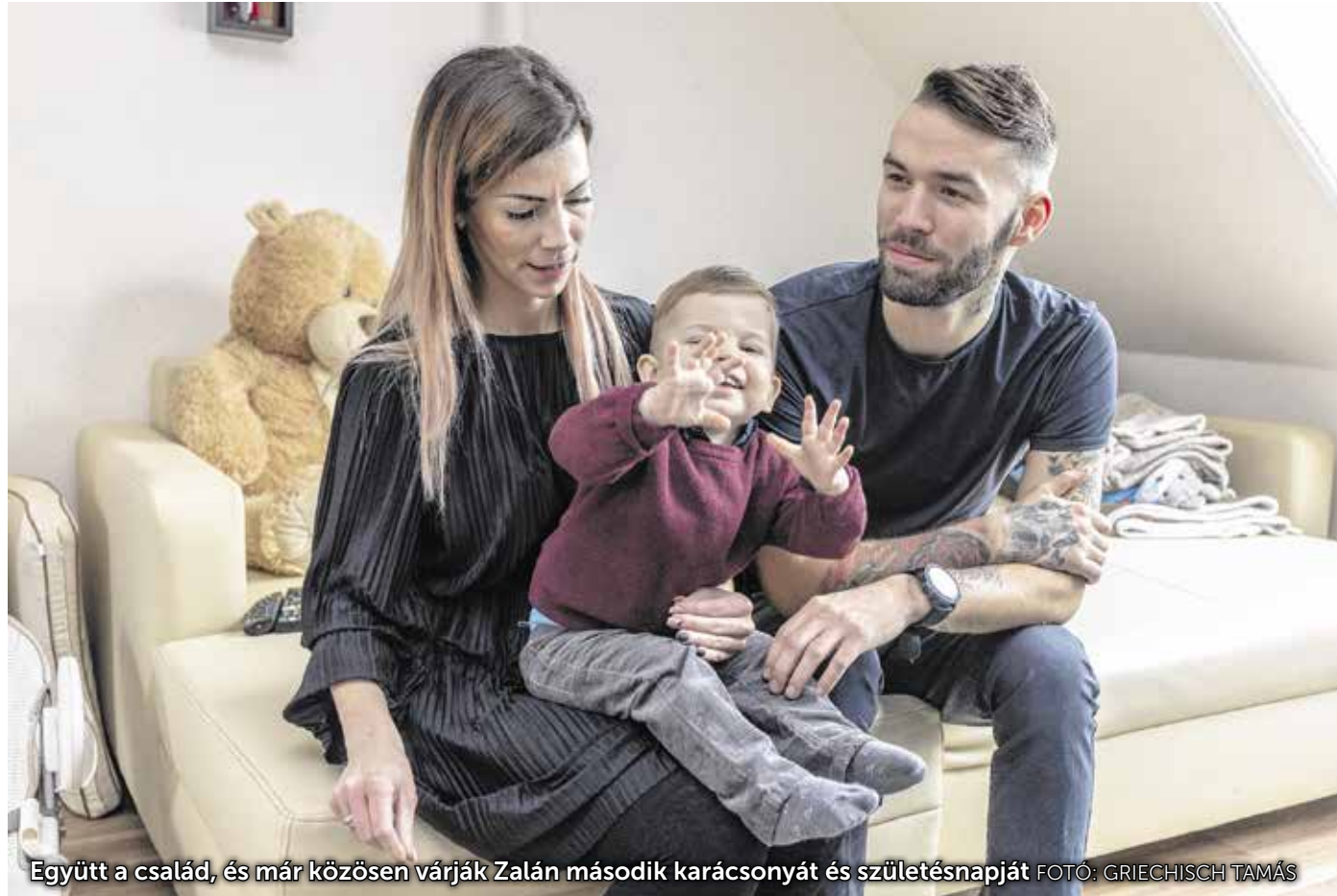
Együtt a család, és már közösen várják Zalán második karácsonyát és születésnapját

– Először Győrbe, majd Budapestre kerültünk kórházba.