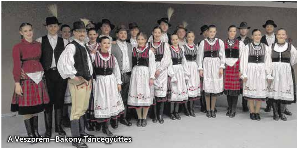
A Veszprém–Bakony Táncegyüttes