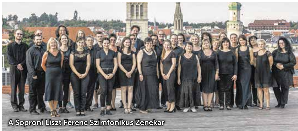
A Soproni Liszt Ferenc Szimfonikus Zenekar