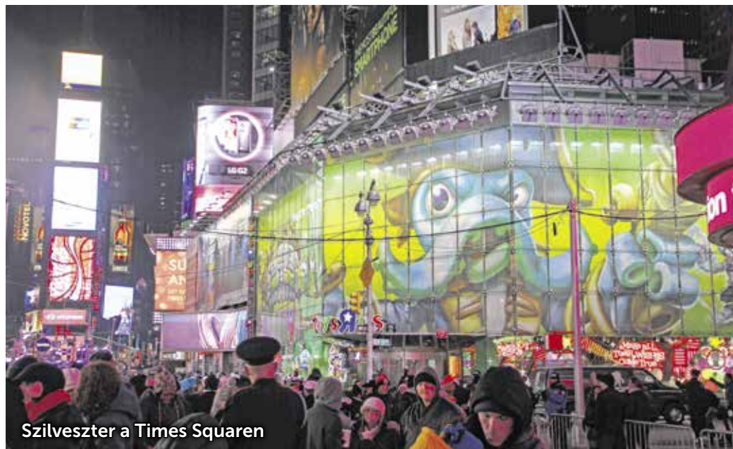
Szilveszter a Times Squaren