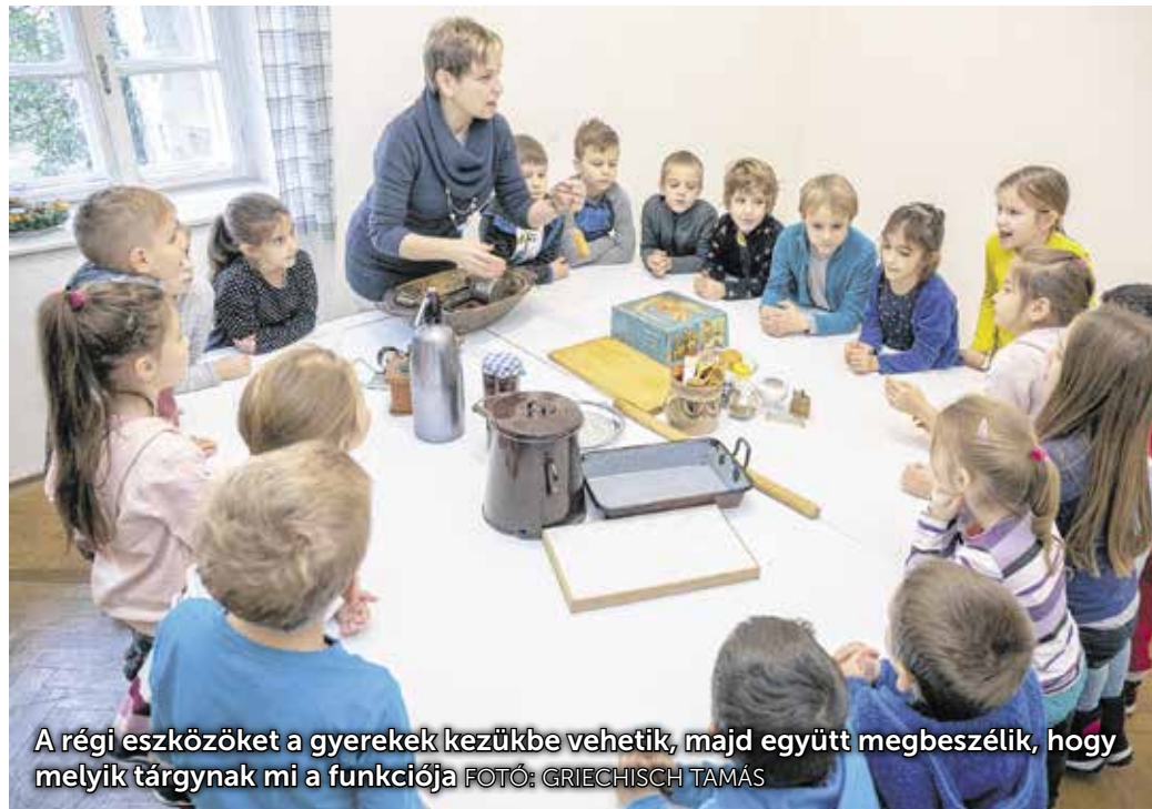
A régi eszközöket a gyerekek kezükbe vehetik, majd együtt megbeszélik, hogy melyik tárgynak mi a funkciója

több kisiskolás is ilyen felkiáltással lépett be a soproni Pékmúzeum mellett lévő foglalkoztatóba. A látványospájból aztán előkerült a zsírosbödön, a szódásszifon és a befőtt, a gyerekek pedig nemcsak az első soproni pékmeszter, hanem az adventi koszorú történetéről is hallhattak.