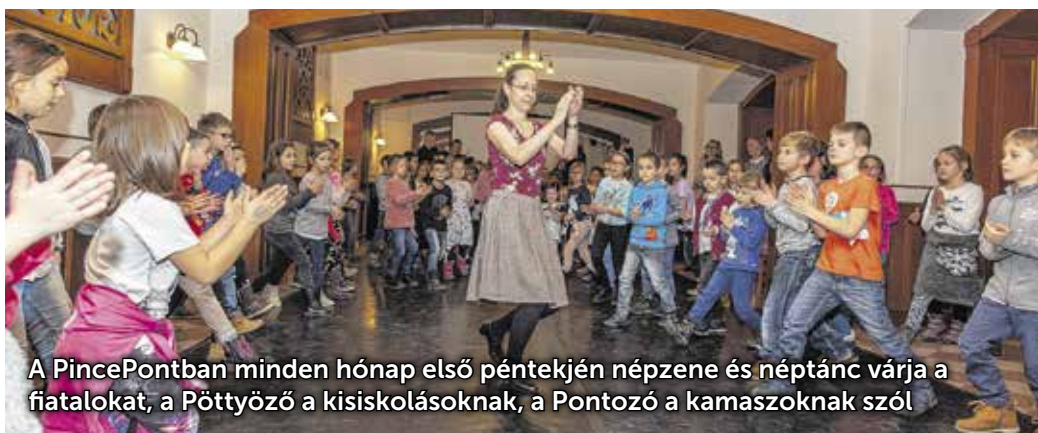
A PincePontban minden hónap első péntekjén népzene és néptánc várja a fiatalokat, a Pöttyöző a kisiskolásoknak, a Pontozó a kamaszoknak szól

természetesen a legfontosabb a táncitanítás. A Pontozó már a kamaszoknak szól 17 és 19 óra között: élő szóval és élő népzenevel. Ezekben a délutánokon a Figurás banda húzza a talpalávalót. A zenészek és a „táncanárrok” maguk is fiatalok, így valóban „egy nyelven” beszélnek a táncművelés közönségével.