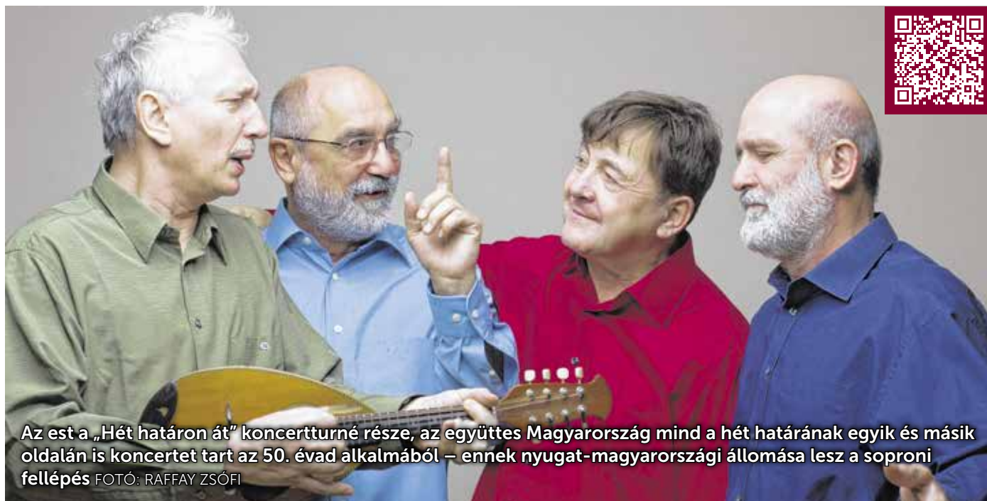
Az est a „Hét határon át” koncertturné része, az együttes Magyarország mind a hét határának egyik és másik oldalán is koncertet tart az 50. évad alkalmából – ennek nyugat-magyarországi állomása lesz a soproni fellépés

A Kaláka azóta szinte meghódította a világot. Kiadott harminc lemezt, dalainak a száma eléri az ezret. A Kaláka fémjelzi a Magyar népmesék és a Mesék Mátyás királyról című ikonikus rajzfilmek zenéit. A soproni fellépésük igazi ünneppé varázsolja a magyar kultúra napját a leghűségesebb városban. Mikó Istvánnal együtt bizonyítják majd, miért is állnak erős verslábakon immár fél évszázada.