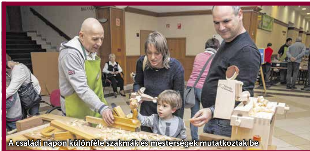
A családi napon különféle szakmák és mesterségek mutatkoztak be

Az Ipar(os)kodó családi napon jelmez viselese kifejezetten ajánlott: aki valamilyen szakma vagy mesterség gúnyjában érkezik, megspórolhatja a belépőt!