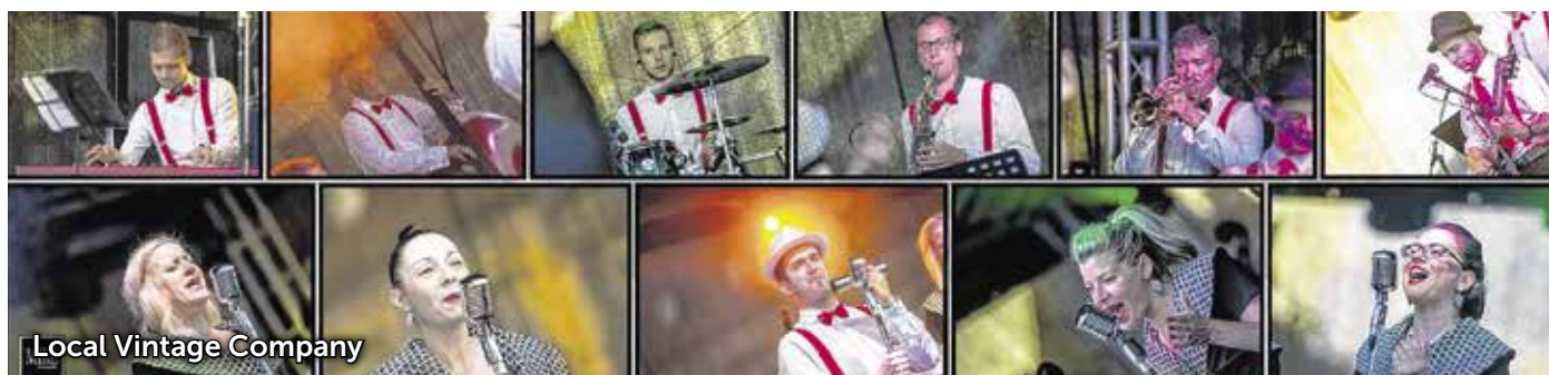
Local Vintage Company

fordulója arra sarkalt, hogy verseit sajátos gondolatfolyammá, személyes monológgá fűzzem össze. Az előadói est gondolati utazásra invitálja a nézőt az ugartól indulva a város kőszánát a megbékélésig. A klasszikus versek mellett kevésbé ismert Ady-művek is helyet kapnak az előadásban. Az estet Kiss Noró megzenésített versei színesítik – mondta Ács Tamás a készülő produkcióról.