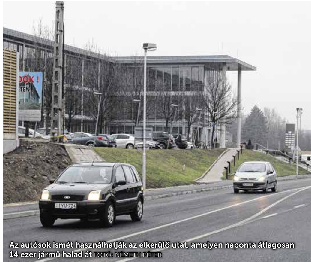
Az autósok ismét használhatják az elkerülő utat, amelyen naponta átlagosan 14 ezer jármű halad át

A városi közlekedés szempontjából nagyon lényeges hír, hogy a közelmúltban megszűnt a forgalomkorlátozás, és ismét