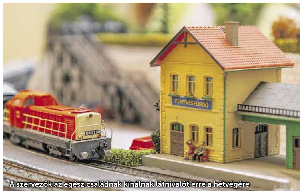
A szervezők az egész családnak kínálnak látnivalót erre a hétvégére

Sopronba. Akik építeni vagy szerelni akarnak a helyszínen, erre is lesz lehetőség a Liszt-központban. A kiállítás pénteken 9-kor nyit (óvodai és iskolai csoportokat is várnak ezen a napon), szombaton és vasárnap pedig 10 és 18 között futnak a szerelvények. A tavalyi évben nagy siker volt az „éjszakai” menet, úgyhogy most azt tervezik, hogy az utolsó fél órában mindhárom napon „by night” üzemelnek a terepasztalok: vagyis csak a belső világítások és a mini kültéri lámpácskák világítanak majd – páratlan élmény lesz gyerekeknek és felnőtteknek egyaránt.