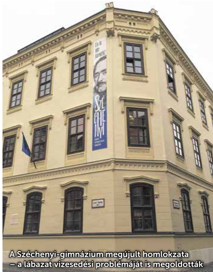
A Széchenyi-gimnázium megújult homlokzata – a lábazat vizesedési problémáját is megoldották

Minőségében és hangulatában is teljesen megújul a soproni belváros – mint arról beszámoltunk, a Modern Városok Program keretében a kormányzat tízmilliárd forintot fordít a városközpont rendbetételére. Egymilliárd forint jut huszonöt önkormányzati, állami, valamint egyházi épület homlokzatának rendbe tételére. Az első ütemben hat épületnél kezdtek el a munkát, a Széchenyi István Gimnázium már fel is öltötte új ruháját. – Megújult a homlokzat, új színt kapott az épület, nagyon fontos feladat volt a lábazatnál a vizesedés problémájának megoldása, ezt egy